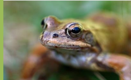
Baso-igel gorria Rana bermeja ( Rana temporaria )