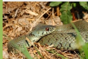
Suge gorbata duna Culebra de collar ibérica ( Natrix astreptophora )