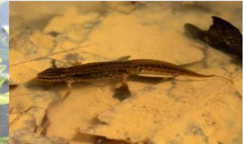
Uhandre palmatua Trión palmeado ( Lissotriton helveticus )