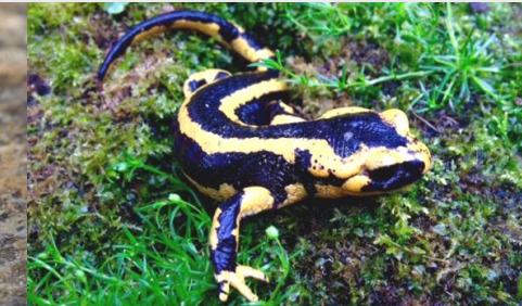
Arrabio arrunta Salamandra común ( Salamandra salamandra )