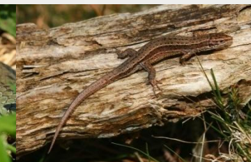
Sugandila bizierrulea Lagartija de turbera ( Zootoca vivipara )