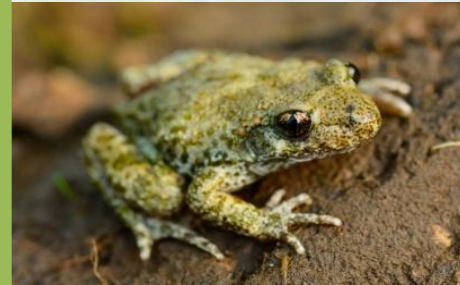
Txantxiku arrunta Sapo partero común ( Alytes obstetricans )