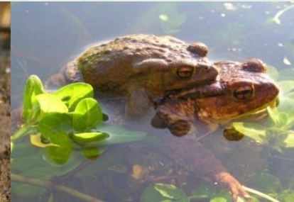
Apo arrunta Sapo común ibérico ( Bufo spinosus )