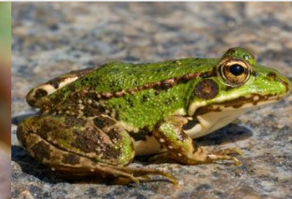
Igel berdea Rana verde ( Pelophylax perezi )