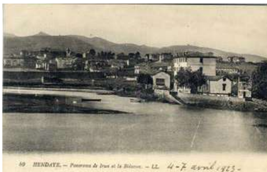
49 HENDAYE. — Panorama de Irun et la Bidassoa. — 12. 4-7 Avril 1925.