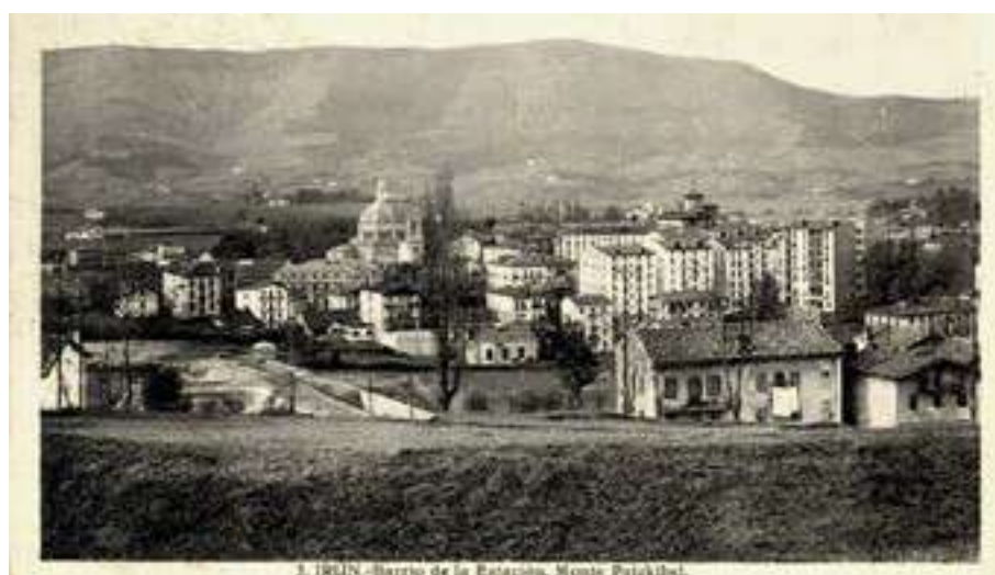
1. IRUN. — Barrio de la Encarnación. Sembré Pujolbat.