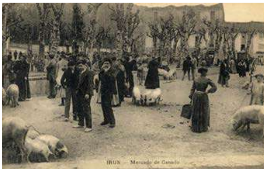
IRUN - Mercado de Ganado