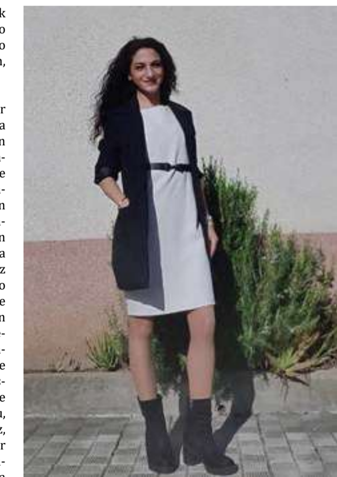
Kale Dor Kayiko elkarteak idatzitako testua