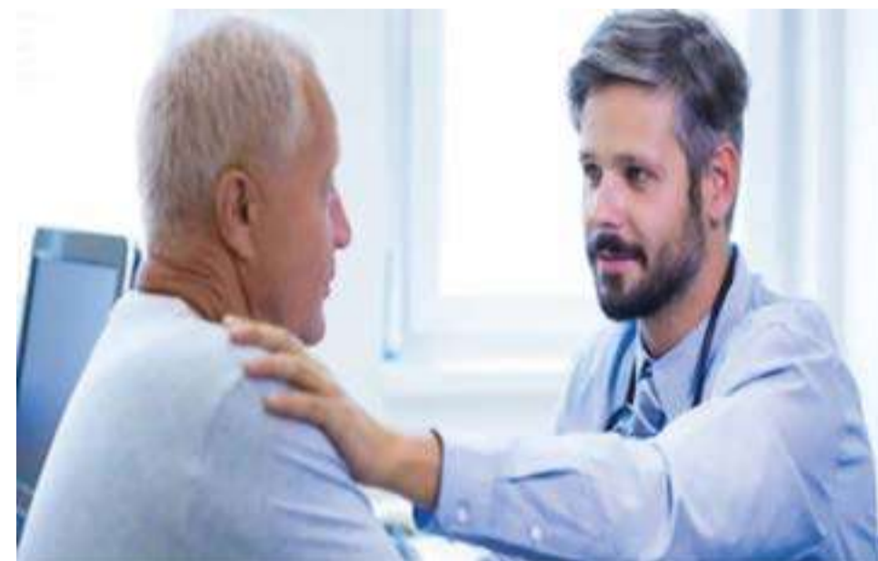
Egilea: Eneko Castejón