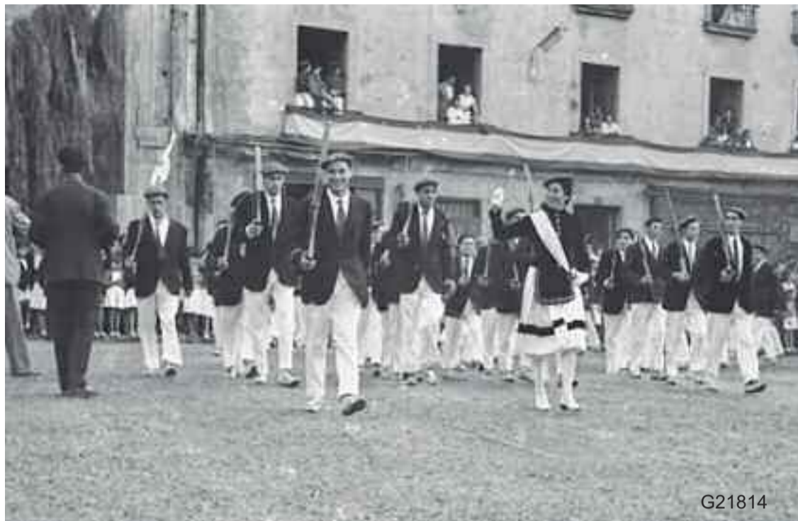
G21045 - Ama Shantalen konpainia 1960 urtean G21539 - Ama Shantalen konpainia 1950 urtean G21814 - Real Union konpainia 1959 urtean