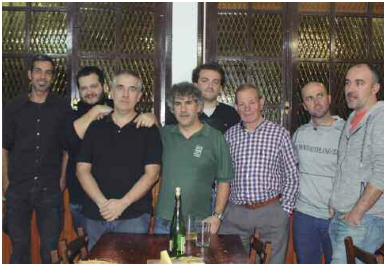
Jaizubiako Elkartean Ostegunetan biltzen diren bertso eskolako kideak

“Hasierako datuekin alderatuta, taldekide kopuruak gora egin du nabarmenki”