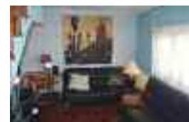
Etxea Hondarribian alokairuan: 80 m 2 -ko azalera, 2 logela, bainugela, egongela eta sukaldia. APARKALEKUA barne. ARGITSUA. Ref: AAH01 / Prezioa: 950