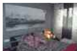
Pisua Puianan salgai: 65 m 2 -ko azalera, 2 logela, bainugela, egongela eta sukaldia. APARKALEKUA ETA TRASTELEKUA barne. Ref: VIP20 / Prezioa: 233.000