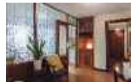
Pisua Bentak auzoan: 70 m 2 -ko azalera, 3 logela, bainugela, egongela, sukaldia, igogailua, balkoia. LEKU LASAIA. Ref: VIP02 / Prezioa: 134.000