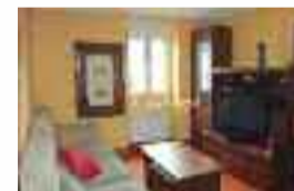
Pisua Anakan salgai: 70 m 2 -ko azalera, 3 logela, bainugela, egongela, sukaldia eta balkoia. LEKU LASAIA eta ARGITSUA. Ref: VPI12 / Prezioa: 135.000