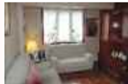
Pisua salgai Nafarroa Hiribidean: 82 m 2 -ko azalera, 3 logela, bainugela, egongela, sukaldia, igogailua. Ref: VIP03 / Prezioa: 146.000