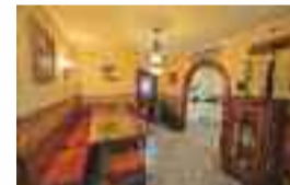
Triplexa salgai Palmera-Monteron: 270 m 2 -ko azalera, 5 logela, 3 bainugela, 50 m 2 -ko egongela, igogailua, terrazak. ARGITSUA. Ref: VIPM01 / Prezioa: 590.000