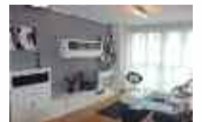
Pisua salgai Udaletxe ondoan: 80 m 2 -ko azalera, 2 logela, 2 bainugela, igogailua. APARKALEKUA eta trastelekua erosteko aukera. ERAIKIN IA BERRIA. Ref: VPI04 / Prezioa: 259.000