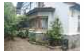
Etxea Anakan salgai: 390 m 2 -ko azalera, 4 logela, 3 bainugela, sukaldia, terrazak, txokoa, aparteko bikoitza. LEKU LASAIA. Ref: VVI / Prezioa: 410.000