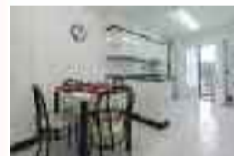
Pisua Lapitze auzoan: 70 m 2 -ko azalera, 2 logela, bainugela, egongela, sukaldia, balkoia, bosgarren solairua. BISTA POLITAK. Ref: VIP01 / Prezioa: 120.000