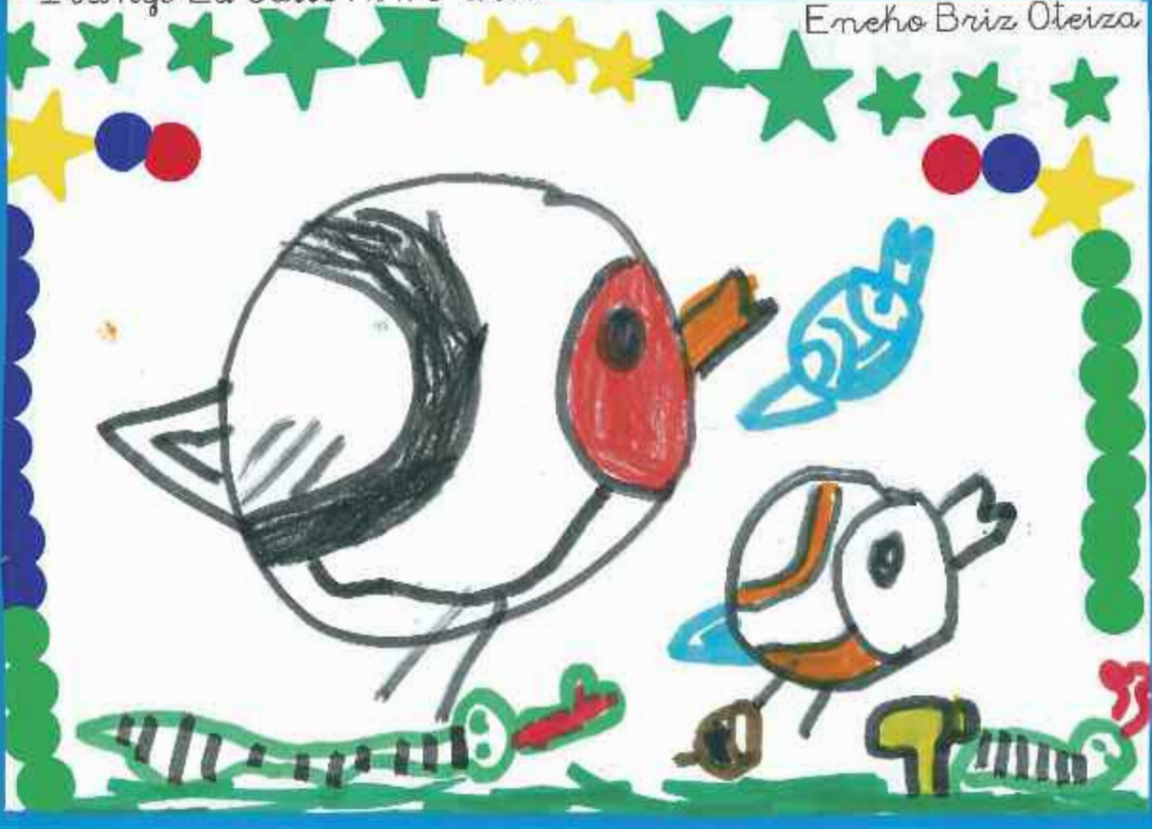
Eneko Briz Oteiza