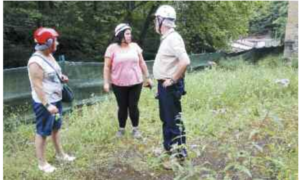
Meatzeei lotutako historia luzea du Irunek. Bisita gidatuen bidez ezagutu daiteke, gaur egun.

Burdin Aroan hasi ziren Aiako Harria zulatzen. Erromatarrek ere etekina atera zioten, eta Aro Modernotik aurrera, atzerriko konpainiek ustiatu zituzten Irungo meatzeak, Bigarren Mundu Gerraren garaian betiko abandonatu zituzten arte. 2008an, Irungo Udalak Irugurutzetako labeak eta meatzea bisitentzako atondu zituen, eta gaur egun, turista askok gehiago dakite Irungo meatzaritzari buruz, irundarrek beraiek baino.