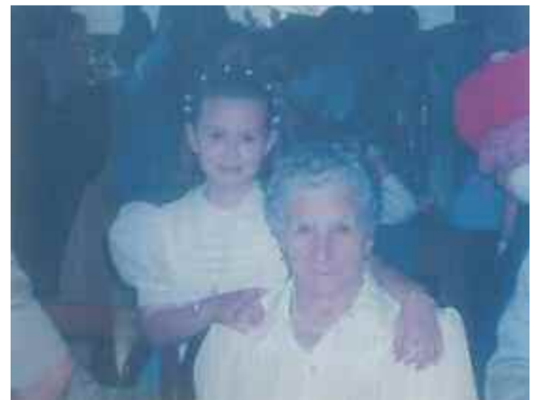
Reimundak 102 urte bete zituen martxoaren 15 ean