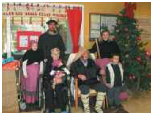
Olentzerori harrera eta Jaiotza Biziduna izan ziren egindako beste bi jarduera.