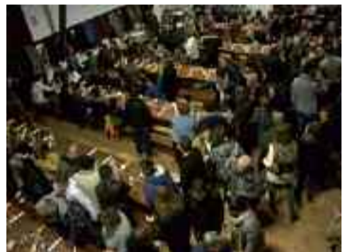
Pasa den urtean lepo - lepo egon zen Ola Sagardotegia txotx denboraldiaren lehen egunetan.

Nahi badute asteburua euskal giroan pasa, trikitixa eta pandero doinuekin, kantuekin, hemen daukate aukera. Etxetik gertu daukate festa eta jan-edana. Hernanira joan