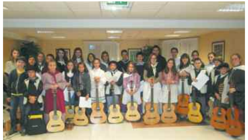
Hamabost gaztek baino gehiagok gitarra kontzertu bat eman zuten.