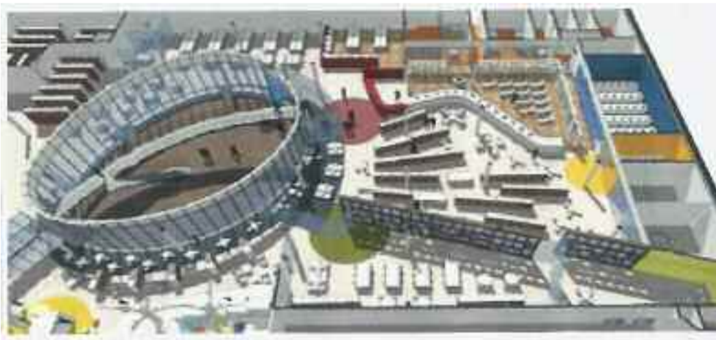
Goiko argazkian, San Juan plazaren ikuspegi bat. Ezkerrean, liburutegi berriaren plano eta aldamenean, ekipamenduaren beiratea.