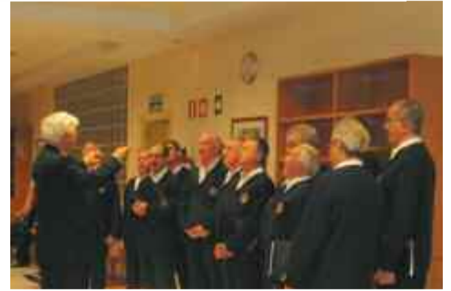
Gaztelubide abesbatzak kantu sorta bat abestu zuen entzuleen gozamenerako.