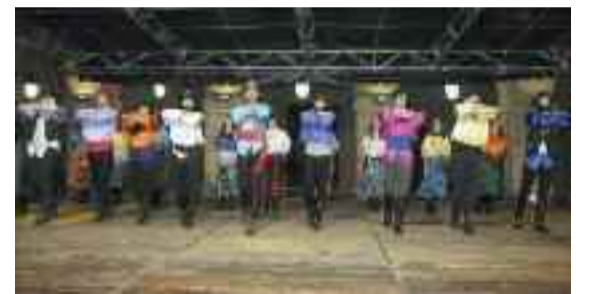
Goian, Adaxkaren Herri Inauteria, behean, Puska biltzea.