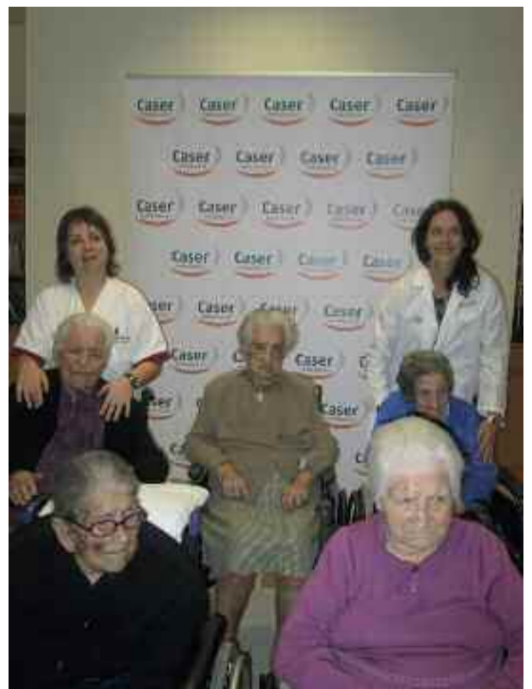
Bi urteko epean, beste bost egoiliar 100 urte izatera iritsiko dira.

Oraingoaz, askoz gehiago dira emakumeak Caser Anakan, gizonak baino.