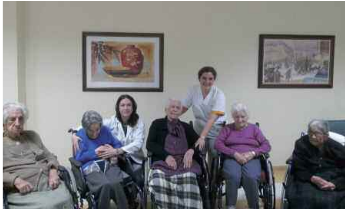
Caser Anakan 100 urte baino gehiago dituzten bost emakumeak omendu dituzte.

Ehun urtetik gorako egoiliarrei aipamen berezia egin nahi izan diete Caser Anakan, martxoaren 8ko ospakizunarekin lotuta. Bost dira guztira, denak emakumeak. “Gizarte hobea” eraikitzeko beharrezko balioen ordezkari direla azpimarratu du Elena de la Fuente zentroko gizarte langileak: “Lana, esfortzua eta ahalegina erakutsi dituzte, mende osan zehar zailtasunei aurre egiteko”.