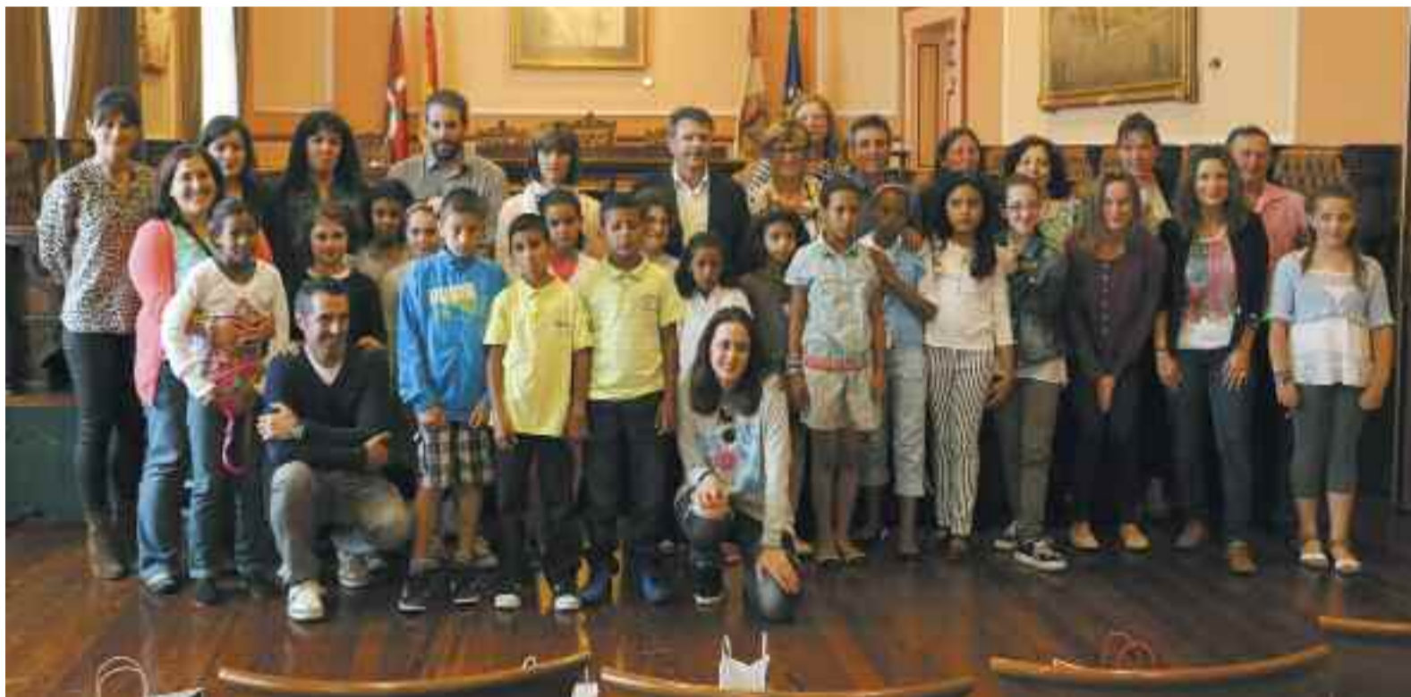
Argazki hauetan, alkatea eta Udaleko beste zenbait zinegotzi, Saharako umeei egindako harrera ekitaldian.

Hamalagarren urtez Saharako zazpi eta hamabi urte bitarteko umeak etorri dira gurera, "Oporrak bakean" programaren bitartez. Euskadi osora iritsi diren hiruhunetatik, hamabi hartu dituzte familia irundarrek.