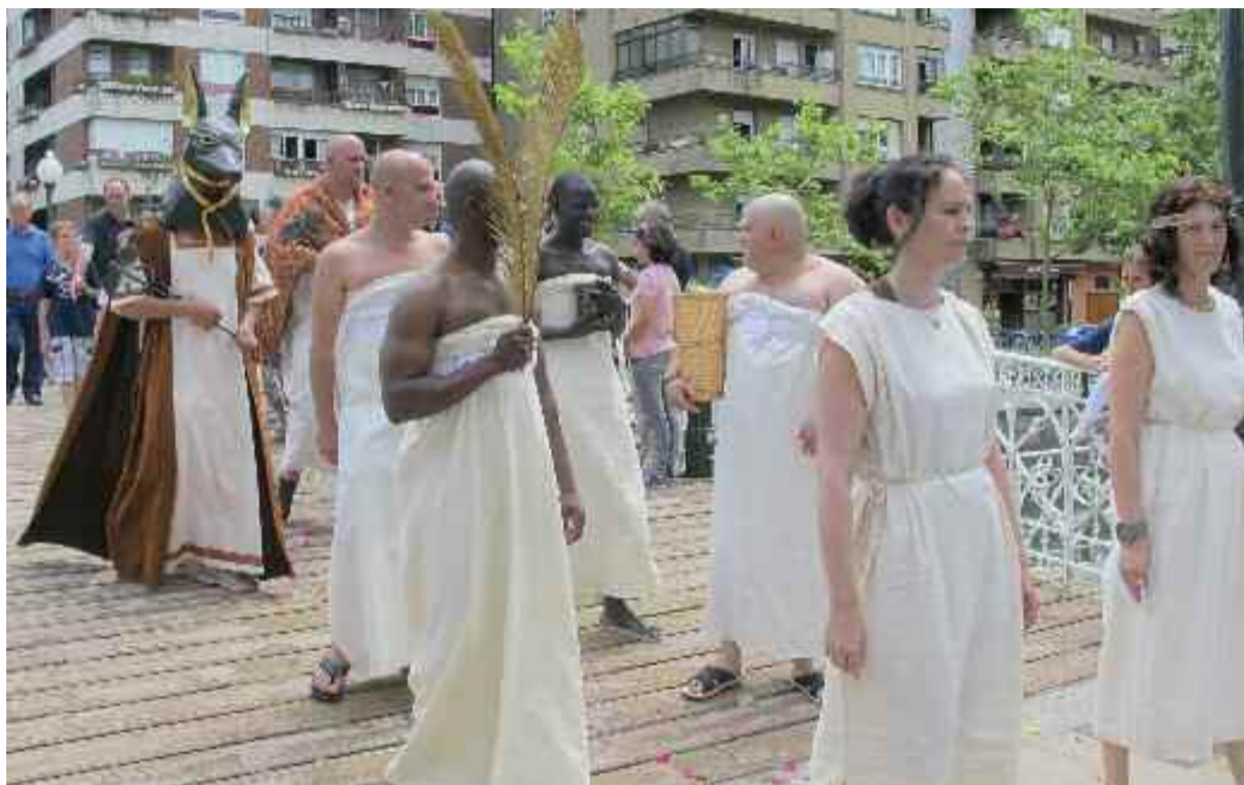
Dies Oiassonis jaialdia