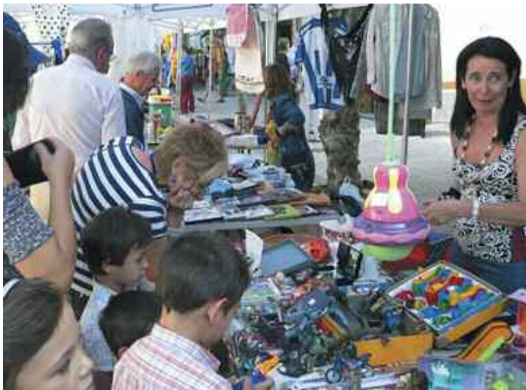
Azokan partikularrek zein elkateek bigarren eskuko gaiak sal ditzakete.

Edozein informazio behar izatera, dei telefono honetara, 902 119 383 .