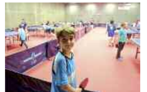
Goian, Bidasoaldeko I. Eskolarteko Txapelketako sarituak, eta behean, parte-hartzaile bat.

behar dira, oso kirol interesgarria baita. Gainera, neska gehiago izanda txapelketa garrantzitsuagoetara joango ginateke". Mahai tenisaren munduan murgildu nahi dutenentzat, hona informazioa: www.lekaeneatm.com