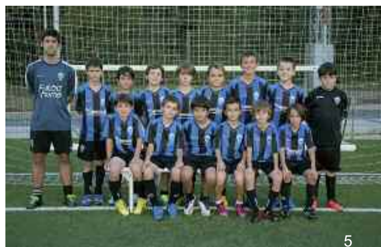
1.- Alebin mailako taldea. 2.- Haur mailakoak. 3.- Erregionalen lehen mailakoak. 4.- Dunboa-Eguzki Kirol Kluba, Lopez Ufarte Nazioarteko Lehiaketaren XXXI. edizioan. 5.- Alebin kategoriakoak.