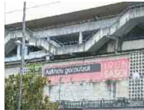
Azken Portu eta Artaleku polikiroldegiak

gazte edo heldu, denek daukate hainbat kirol jardueratan aritzeko aukera. Igerilekuari dagokionez, arrakastatsuenak hasiberrientzako ikastaroak izaten dira. Aretoetan, berriz, pilatesa eta cycling delakoa dira izarrak.