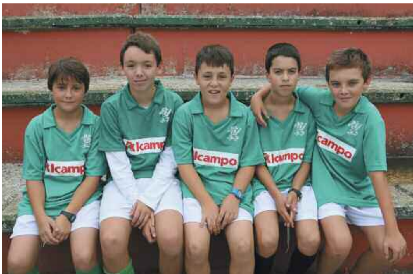
Eskola Kirola programan parte hartzen duten zenbait haur.

Kirolarekin lotura estua duen hiria da Irun. Asko dira goi mailan izan diren eta ari diren elkarte eta kirolariak. Hainbat kirol eta modalitatetan lortu dute oihartzuna irundarrek. Baina, horretarako, txikitatik kirol jarduera sustatzea ezinbestekoa izaten da. Udalak martxan jarritako Eskola Kirola eta Ikas Sasoi programek formazio-lan horixe dute helburu.