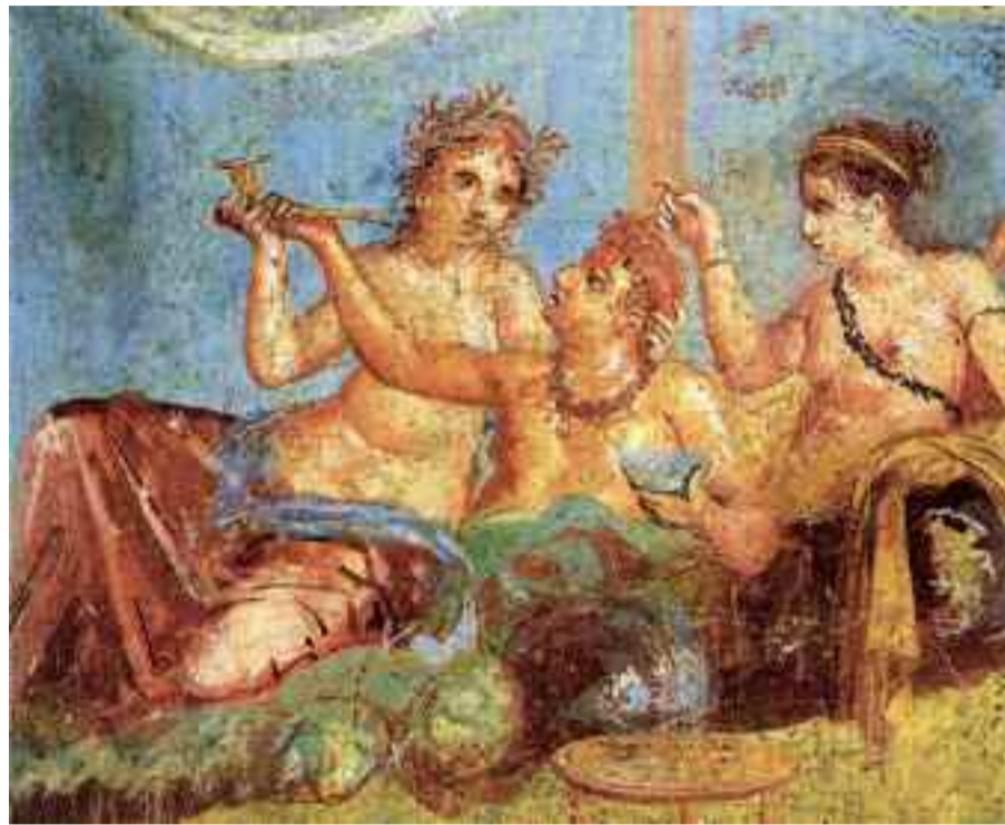
Erromatarrekin batera etorri zen lehen iraultza garrantzitsua euskal sukaldaritzan.

Hilean behin, Iruneroren tarte honetara, euskal sukaldaritzaren historia gaingiroki eta hitz lauz ekarriko dugu. Oraingoan hastapenak izango ditugu hizpide, Santimamiñeko kobazuloetatik hasita.