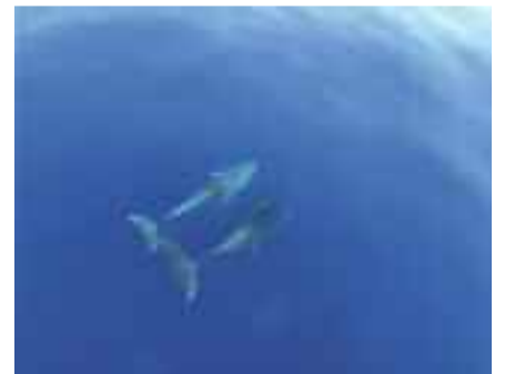
1.-Es Vedráko Parke Naturala. 2.- Ilunabarra konpainia onean. 3.- Urpekariak, hondoa esploratzen. 4.- Izurdeak.