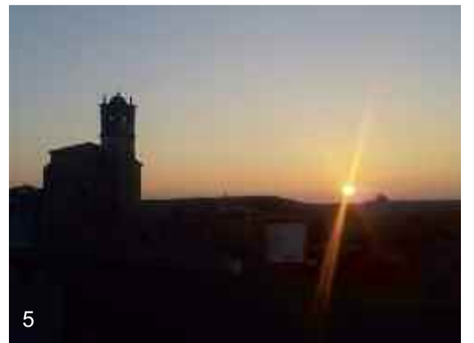
4.- Errioxa; amaigabeko lautadak. 5.- Ilunabar ederra Burgoseko herrixka batean.