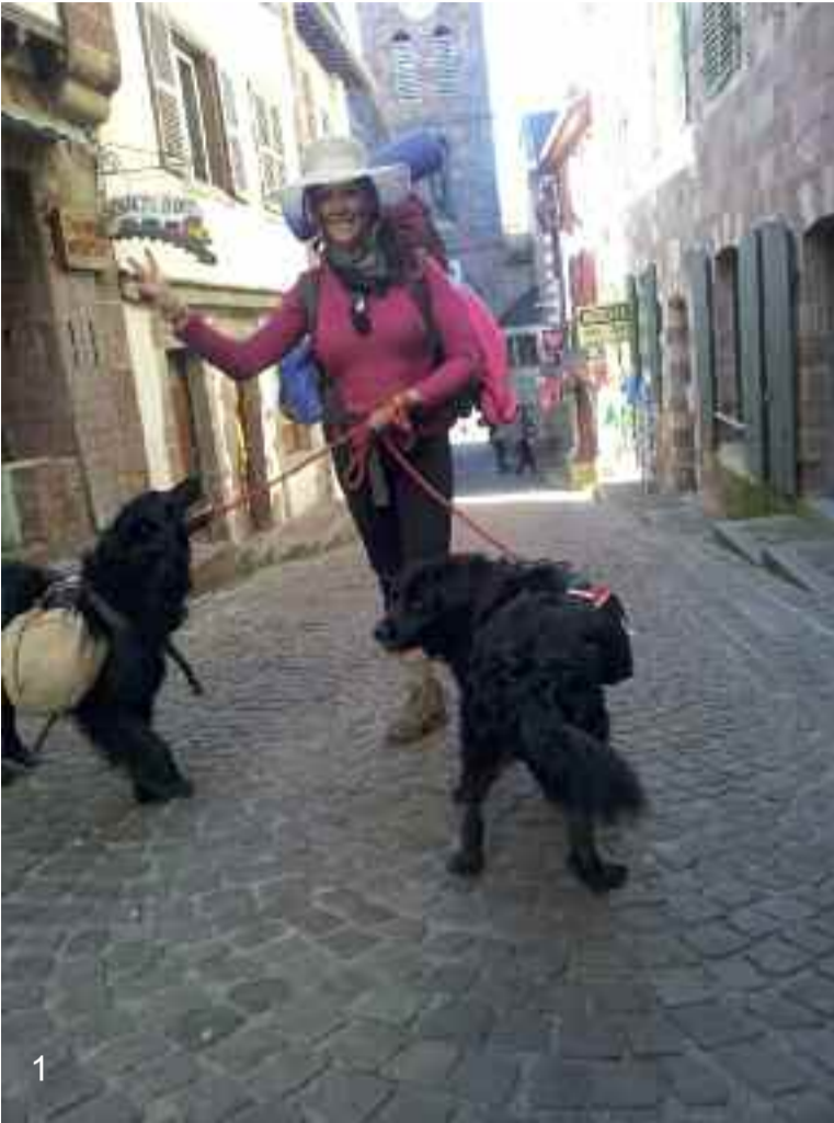
1.- Donibane Garazin, abiatzeko unean, zakurrak pozez zorutzen. 2.- Iruñetik hurbil. Zizur Nagusian. 3.- Orreaga: Santiagora 790 km besterik ez!