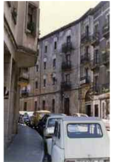
Foruen karrika 1987an. IUA: 41335

Lehenengo argazkian Union deitzen zeneko ikuspegi bat. Eskuineko aldean merkatu zaharraren atzeko aldea ikusten da. Bigarren argazkian, Gerra Zibileko