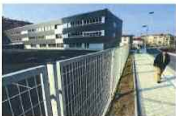
Gure ikastetxea EGUZKITZA da. Victoriano Juaristi kalean dago