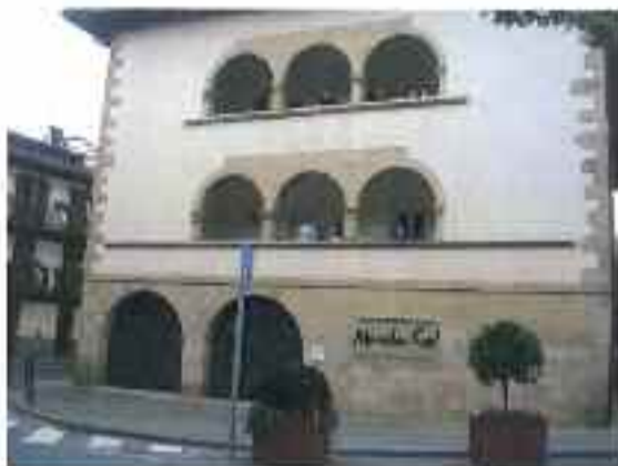
Menchu Gal muscoa Vega de Eguzkitza kalean dago