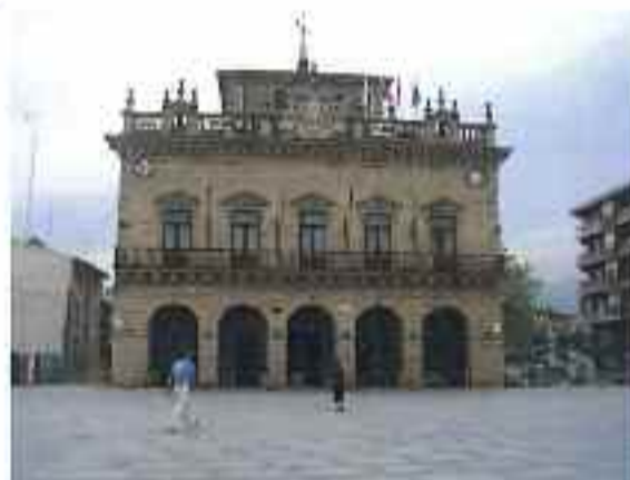
Irungo udaletxea San Juan enparantzan dago