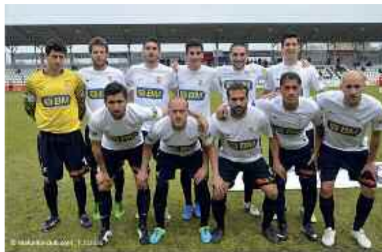
Taldea, Tudelanoren aurka jokatu zuenean.