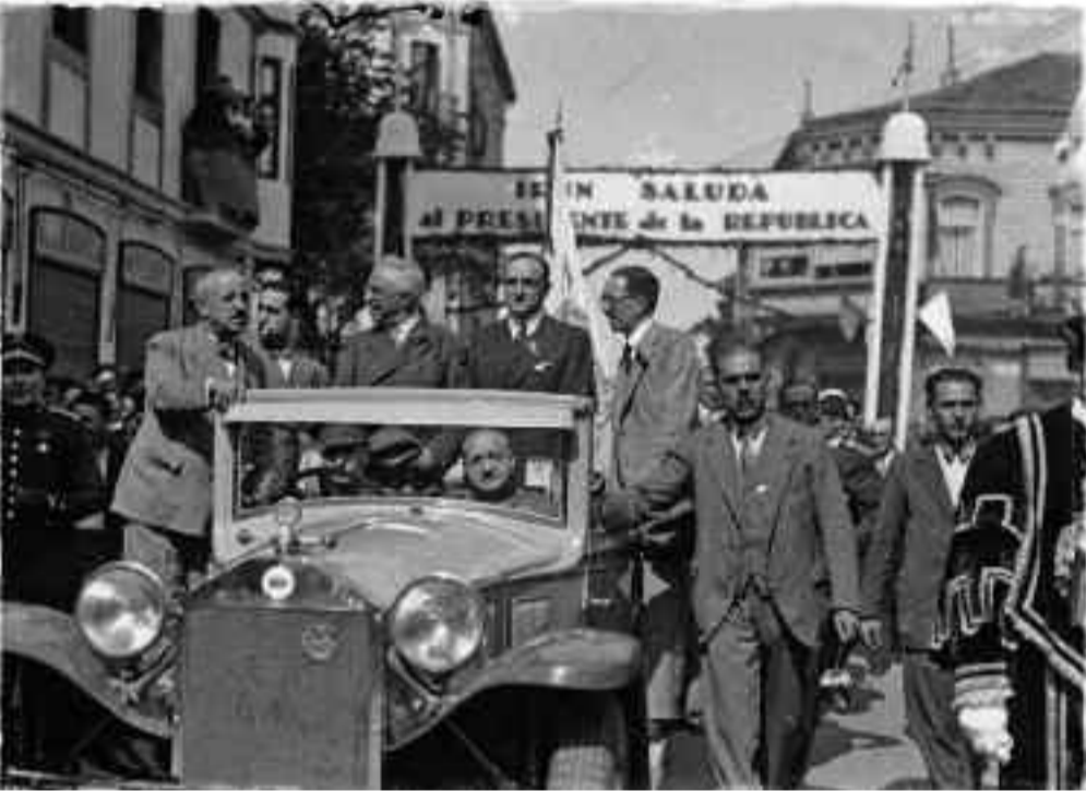
Niceto Alcalá-Zamora II. Errepublikako presidentea, Irunen 1932ko irailaren 14an.