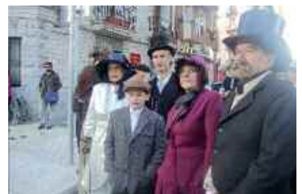
Herritar burges talde bat.