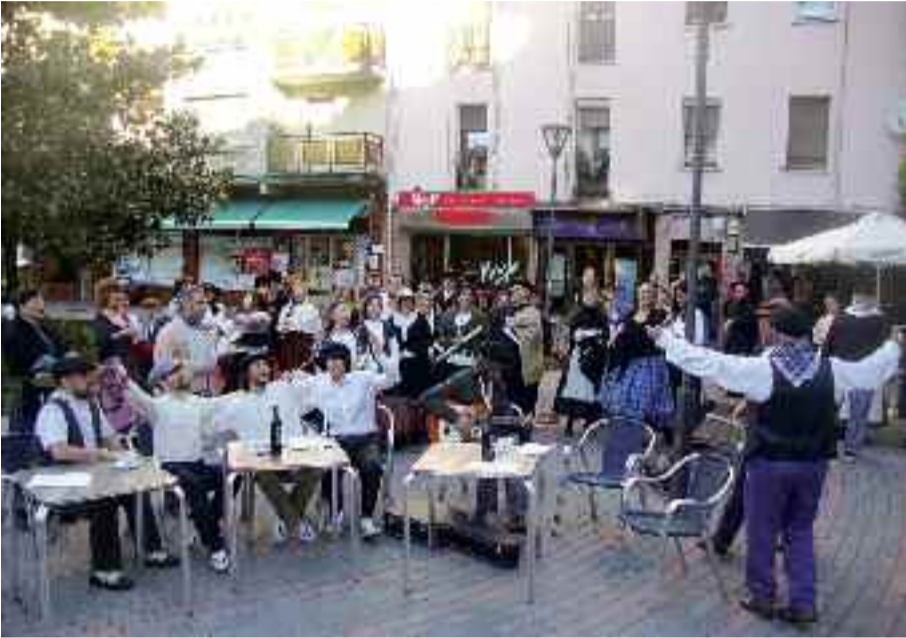
Ezkerrean, tabernako eszena. Eskuinean, garaiko Irungo goi mailako pertsonaiak.