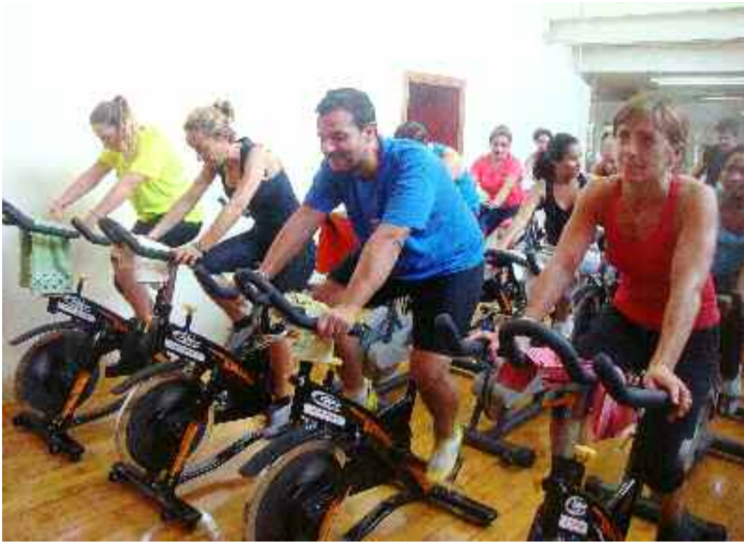
Goian, Cycling saio bat. Eskuinean, Zumba. Behean, Shirai maisua Kirolako arte martzialetako talde batekin.