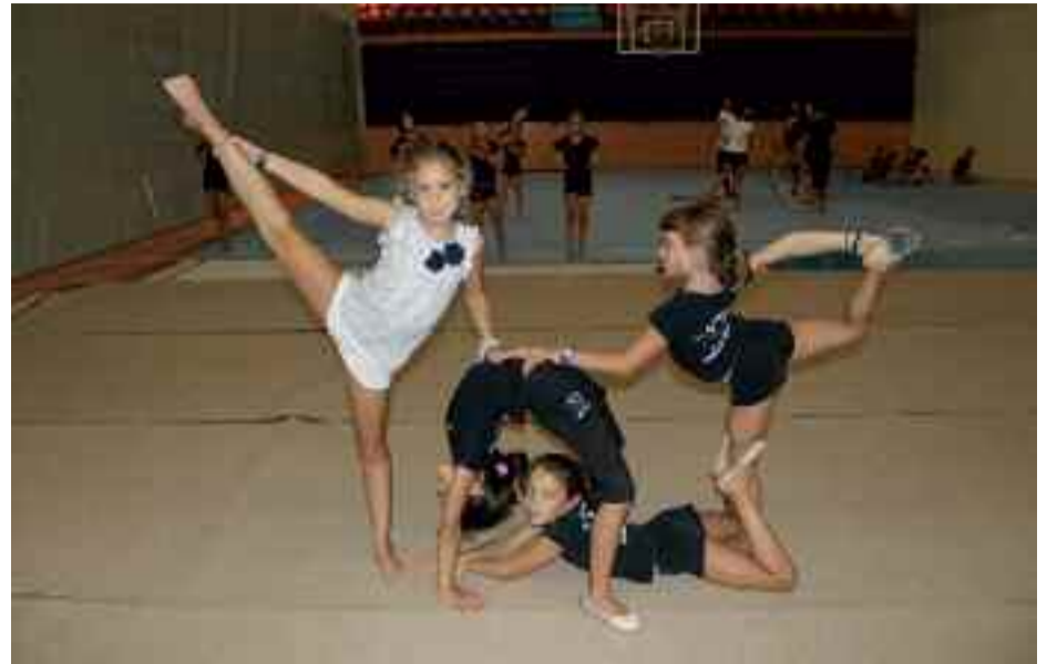
Ayamendi Klubeko lau gimnasta, ariketa bat egiten.