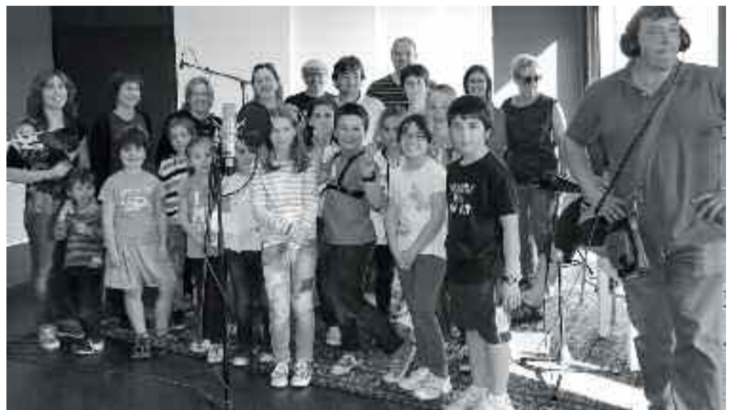
"2.3 Bertso berriak gure seme-alabei jarriak" kantuari dagokion argazkia. Eguzkitza ikastetxeko zenbait guraso eta seme-alabak parte hartu dute.

http://www.youtube.com/watch?v=x_5Wlz-f2O8