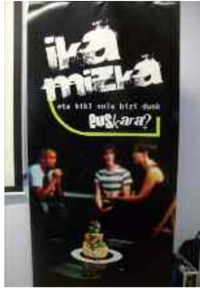
Ika Mizka jardueraren inguruko irudi sorta.