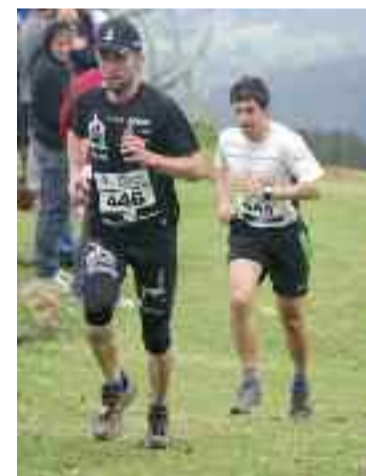
Bi mugalari aurtengo Erlaitz - Aiako Harria Maratoi Erdian.

sartu ziren taldean. "Ekimen ugari antolatzen dituzte. Garrantzitsua Erlaitz - Aiako Harria Erdi Maratoia da. Sare sozialen bitartez geratu eta 50-70 bat lagun elkartu ohi dira. Oso giro ona dute. Korrika egiten dute,