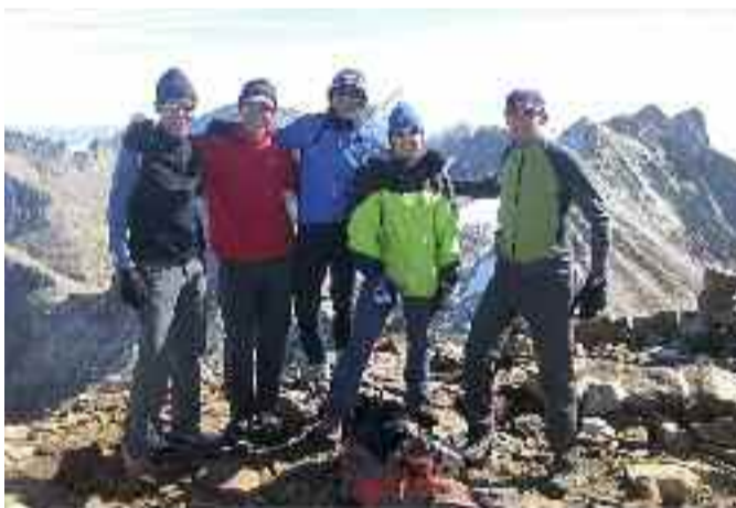
Gorgs Blancsera igoera hasi baino lehen.