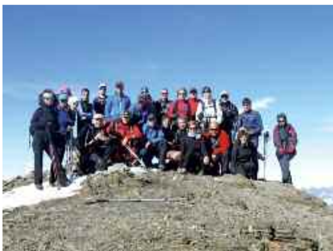
Erlaitzeko kide talde bat Pimeneko tontorrean.

30 eta 60 urte bitartekoak dira nagusi elkartean. Mendi-lasterketako sekzioan, berriz, gaztetxoak dira nagusi. Presidentea dioenez, modan jarri den mendi ekimena da. Mugalarriak izena dute eta orain dela pare bat urte