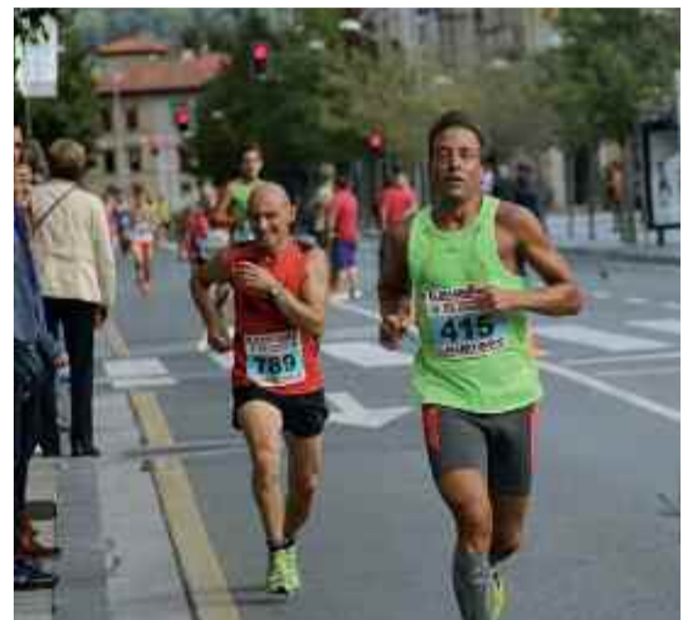
Aurtengo Txingudi Korrikako irudi bat.