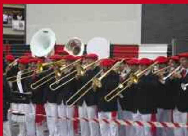
Ezkerrean, Jeneralak kapitainei dei egin zienekoa. Eskuinean, Banda bere kantinerarekin.