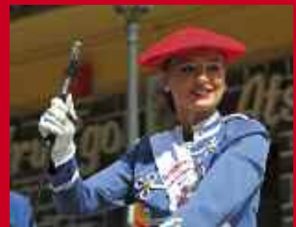
Artilleriako kantinera, agurtzen.