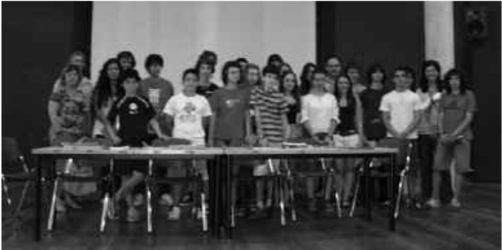
Sari banaketa ekitaldian parte hartu zuten guztien argazkia.

Txingudi Ikastolako bigarren hezkuntzako 400dik gora ikasleak institutuak antolatu dituen Literatur Sormenaren sarietan parte hartu dute 2010-2011 ikasturtean zehar. Joan den ekainaren 15ean lehiaketako finalistak eta irabazleak areto nagusian elkartu ziren, egindako lanengatik sariak eta txaloak jasotzera. Idazle gaztetxo hauen obra guztiak biltzen dituen liburua eskuratu zuten, Txingudiko Guraso Elkartearen diru-laguntzaz argitaratua.