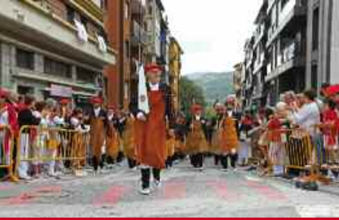
Hatxeroak, Arrankada egin ondoren, San Juan plazara sartzen. Eskuinean, jenerala, troparen kargu eginda.