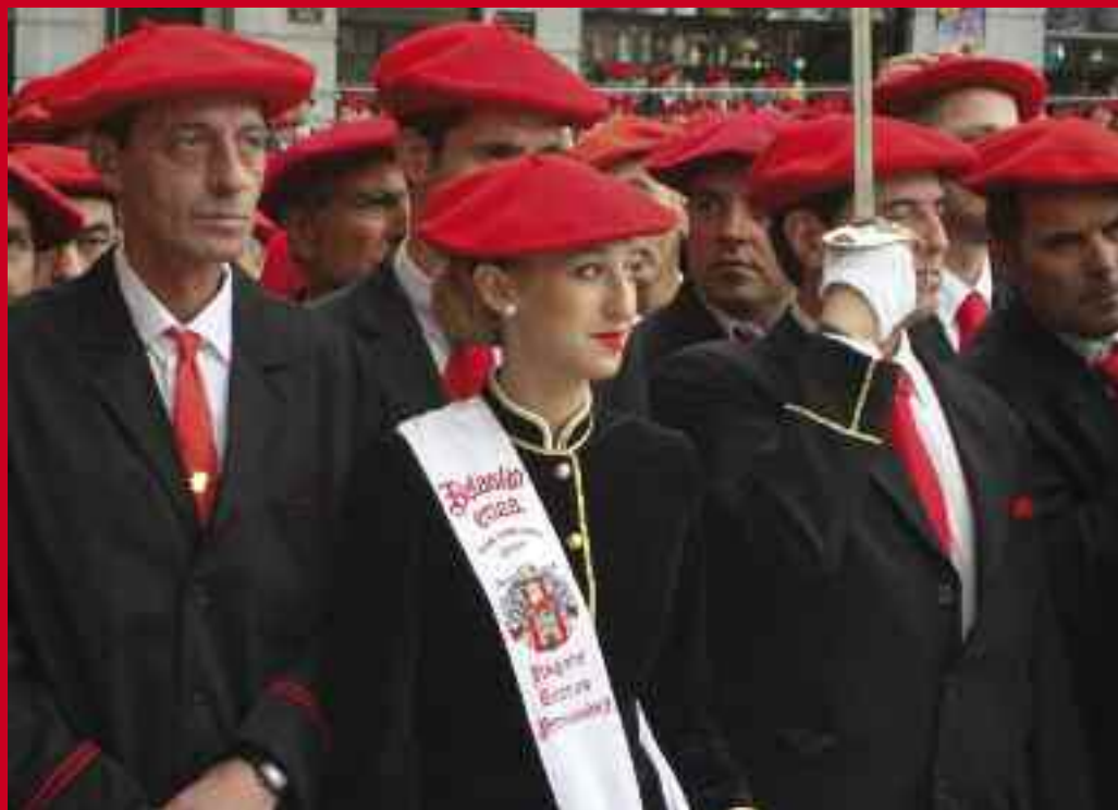
Belasko Eneko kantinera San Juan plazan.