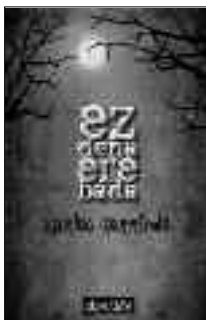
Liburua: Ez dena ere bada Egilea: Karlos Gorrindo Argitaletxea: Desclée

Jomugan ediren duten lekua ez zaie arrotz egin neska-mutilei. Ez horixe. Euren hizkuntza-