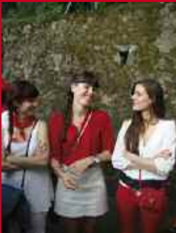
Goian eta behean, ikusleak Artalekun. Behean, eskuinean, eskopetariak Kolon ibilbidean.