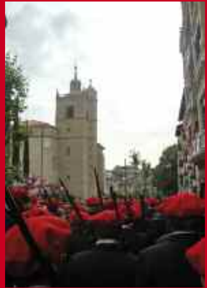
Ezkerrean, Bidasoa konpainiak udaletxean Irungo bandera jaso zuenean. Eskuinean, tropa Junkal eliza aldera.