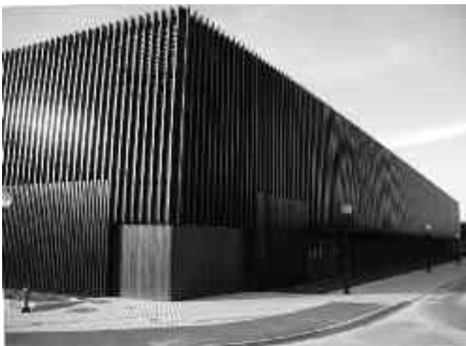
Gordailuak 8.450 metro koadro ditu.