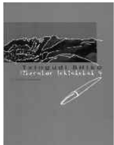
Literatur Lehiaketetako lanak liburu batera ekarri dira.