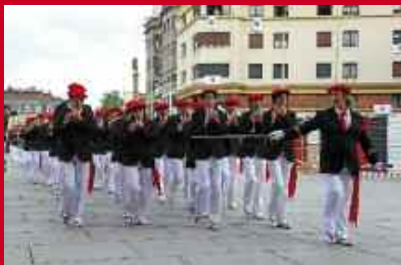
Ama Xantalen konpainia, San Juan plazara sartzen.