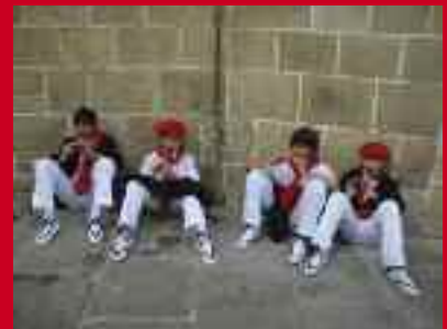
Artilleriako bateria San Juan plazan. Eskuinean, Junkal plazatzoko geldialdian soldadu gazte taldetxo bat, atsedena hartzen.