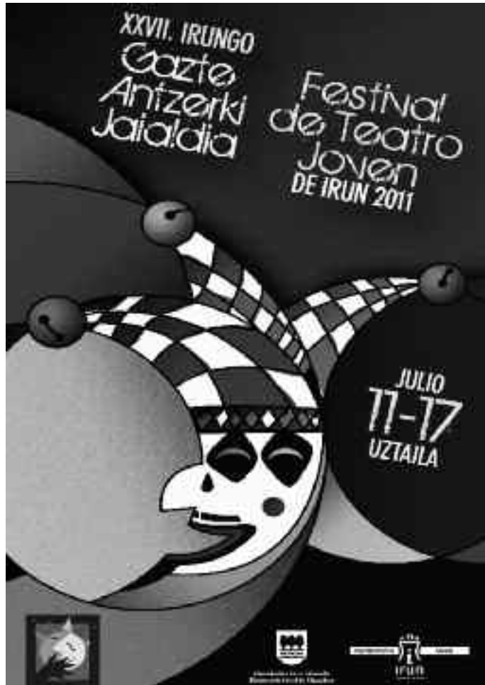
XXVII. edizioko kartela

Gainera, jendearen parte-hartzea bultzatzeko hainbat jarduera izango dira. Break dantza Master Class bat prestatu da Fama 5 saioko Imanol Pesorekin. Halaber, txotxongilo tailer bat antolatu da. Amaiaiko ikuskizun bakarrak 5 euro balio du, eta gainontzekoak doan izango dira.