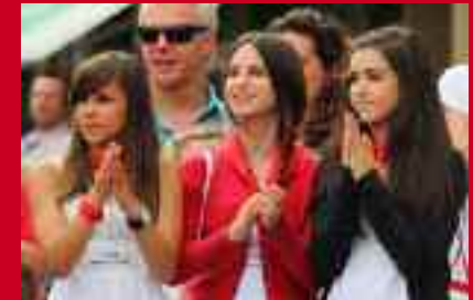
Ezkerrean, Danborrada Kale Nagusian behe- ra arratsaldean. Goian, ikusleak.