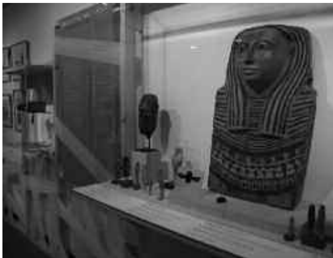
Sarkofago baten zati bat ikus daiteke.

Aurrena antzinako Egiptori buruzkoa da. Zenbait pieza arkeologikoz osatua da, tartean sarkofago baten zati bat. Bigarrenak, XVIII. mendean