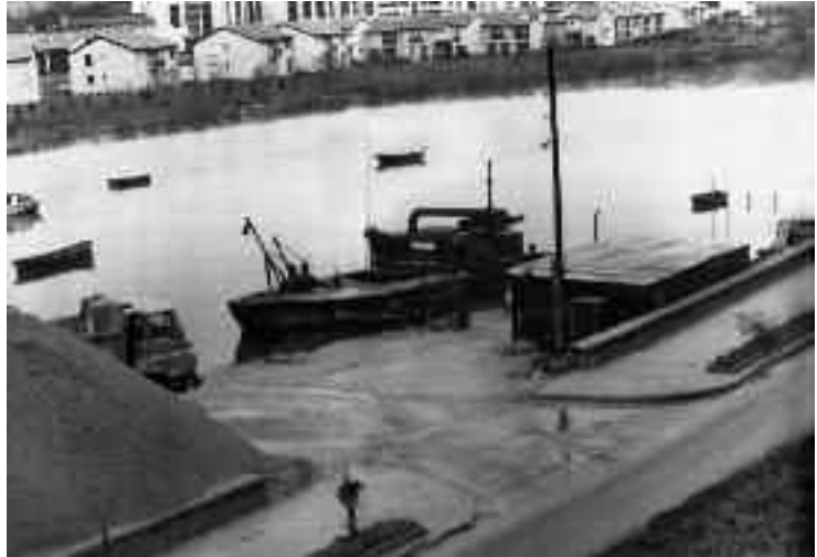
Arenas Carrillo Behobiko enpresa garrantzitsua izan zen urte askoan.

Liburua apailatzeko, egileak 568 irudi hautatu ditu