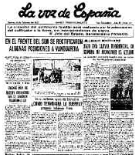
La Voz de España frankistek sortu zuten 1936. urtean, La Voz de Guipúzcoa zenaren instalazioak konfiskatu ondoren.

Gaur egun orijinalak artxiboan kontsulta daitezke soilik, baina etorkizunean digitalizatu eta udalaren web orrian txertatuko dira.