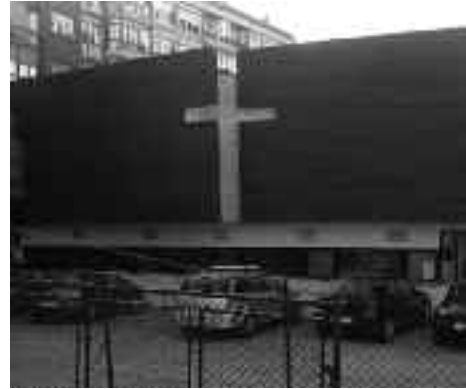
Goian, eliztar laguntzaile beterranoak. Eskuinean, behean, aurrealdea zaharberritze lanak baino lehen; goian, ondoren.