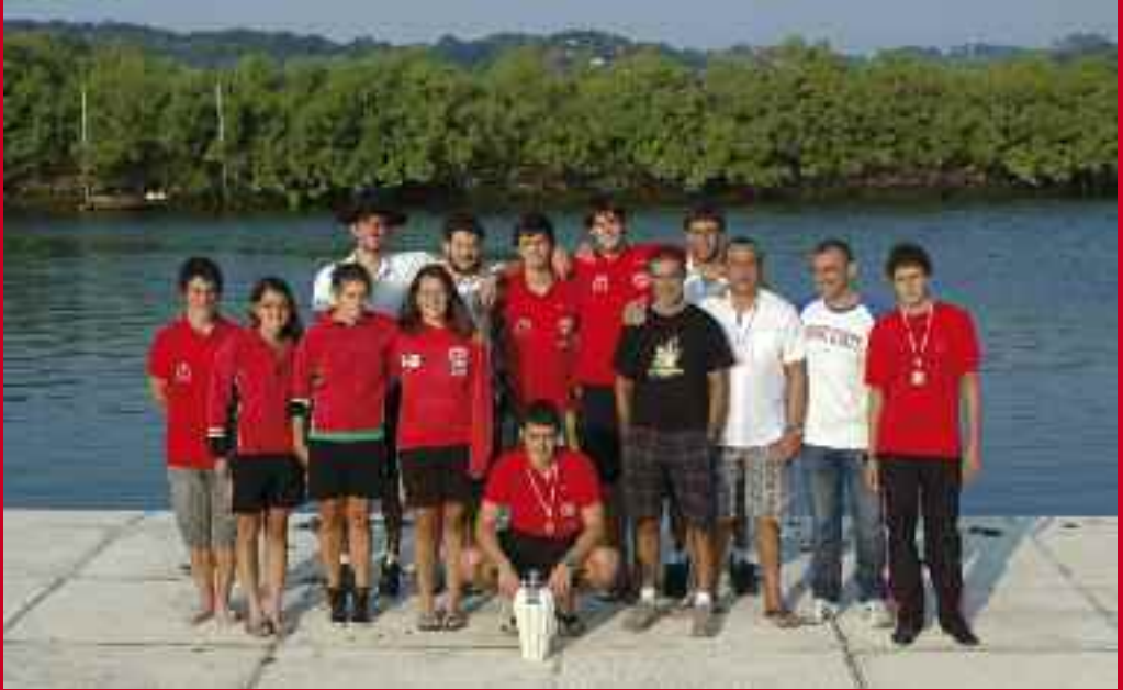
2011ko Bidasoa Ibaiaren Nazioarteko Jaitsiera irabazi zuten Santiagotarretako kirolariak.