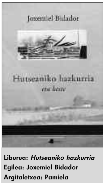
Liburua: Hutseaniko hazkurria Egilea: Joxemiel Bidador Argitaletxea: Pamiela

Barneko etsia urraturik, kanpo etsiaz dihardu buru-belarri segidan. Hari jarraikiz hauxe ikasi diot: jaioz geroztik heriotzari buruz tai gabe abiatu, buru-belarri ezpalkatzen ditugu