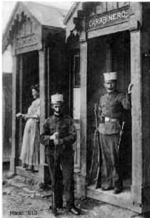
Behobiko karabineroen garita, eta emazainarena (1910 urte inguruko argazkia).

Liburua apailatzeko, egileak azken 25 urteotan zehar bildu dituen argazki kopuru ikaragarria baliatu du. Guztira 510 orrialdeko argitalpena da, 568 argazki hautatu eta euskaraz nahiz gaztelaniaz idatzitako testuez osatua. Castillok liburuaren alderdi grafikoa nabarmentu zuen, hain zuzen ere. “Historia-liburu gutxik orrialde kopurua baino argazki gehiago dituzte; izan ere, honetan historia irudien bidez kontaktzen baita”. Argazkiak medio, auzoko historiaren alderik bitxienak eta garrantzizkoenak helarazten dira, argazki-oin laburrez eta esanahia azaltzen duten testuez lagunduta. Irudietan 150 urteko gorabeherak erakusten dira, XIX. mendeko grabatuetatik hasita gaur egungo