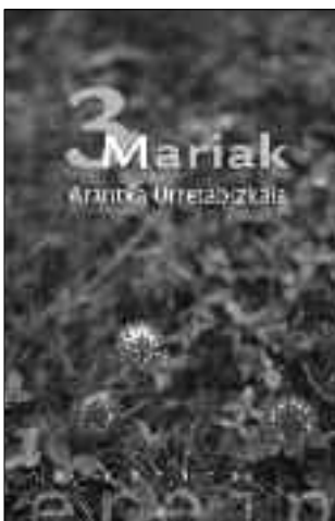
Liburua: 3 Mariak Egilea: Arantxa Urretabizkaia Argitaletxea: Erein

2. Zahartzaroan sartu berri diren hiru pertsonen istorioa den aldetik, protagonistek iraganaren arrastoak gogoan eta larruan dituztela, hiru nortasunen –osagarriren– bidez laketuko li-