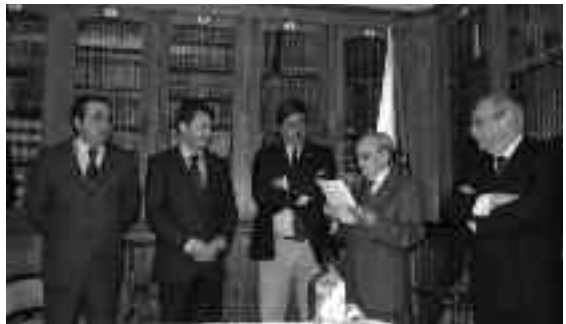
Omendua alkatearekin eta Casinoko ordezkariekin.