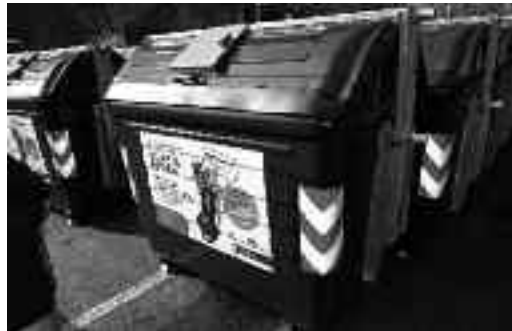
Hondakinak zuzenean bota daitezke edukiontzira, edo konpostagarriak diren poltsetan.