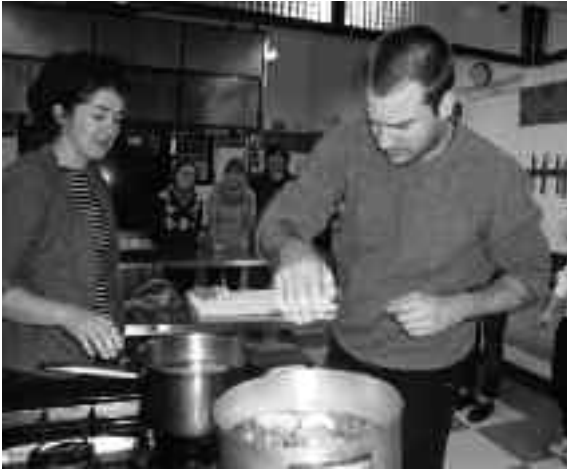
Goian, Urkiri sukaldaria salda nola prestatu irakasten. Eskuinean, bi gazte oilaskoa zatitzen.