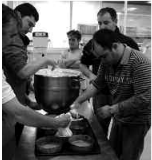
Garaguneko antolatutako jarduera bat.

Garagunean bertan gauzatzen duten jarduera nagusietako bat bitxiak egitea da. Helburua erabilera ematea denez, bada, azoka txikia antolatzen dute zentroan astean behin. Halaber, musika entzutea, ordenagailuan aritzea edo puzzleak montatzea zentroan aurrera eramane daitezkeen ekintzetako batzuk dira.