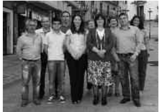
Irungo PPKo 10 lehenengo hautagaiak.