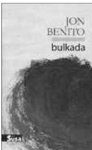
Liburua: Bulkada Egilea: Jon Benito Argitaletxea: Susa

Idazlea hil zuen, baina idazlea bizi da. Hil eta gero bere buruari “nor naiz ni” itauntzen jarraitzen baitu Benitok. Amarengandik erditua da, baina ez du haren erdia izan nahi. Ez du aitaren aldetikoez duten –kasurako– baino zalantza gutxiago izan. Alta, berezko bidea urratu nahi du. Bizitzan esperimentatzen ez dena, bizi gal-