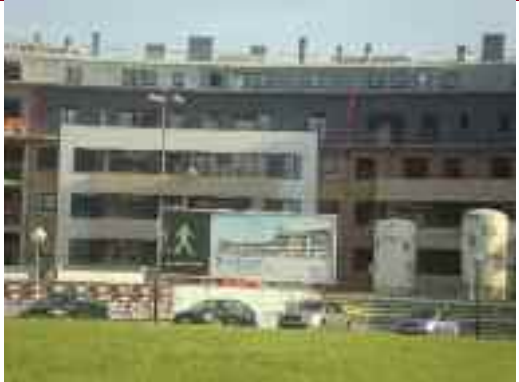
Altzukaitz kaleko etxe berriak.

Sustapen berrikoen kasuan ere salneurriek pixka bat behera egin arren, gehiago ezin dela diote Etxe Oneneko profesionalak “lur-sailak