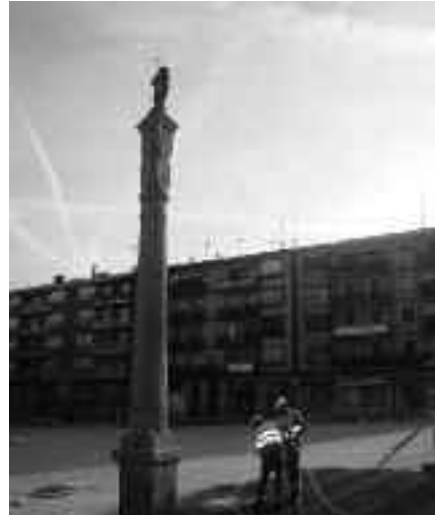
2007ko martxoan haizeak bota zuenetik zutabea ez da lehengo tokian egon.

Páezek esan duenez "ekainaren amaierarako plaza zolatua egotea espero da, behin betiko izan behar duen moduan, obaloraino. Gainerako zolatze-lanak obran jarraituko dute.