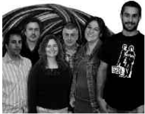
Zerrendako sei lehen hautagaiak.

- Oteizaren tailerra izan zena artisten tailerra