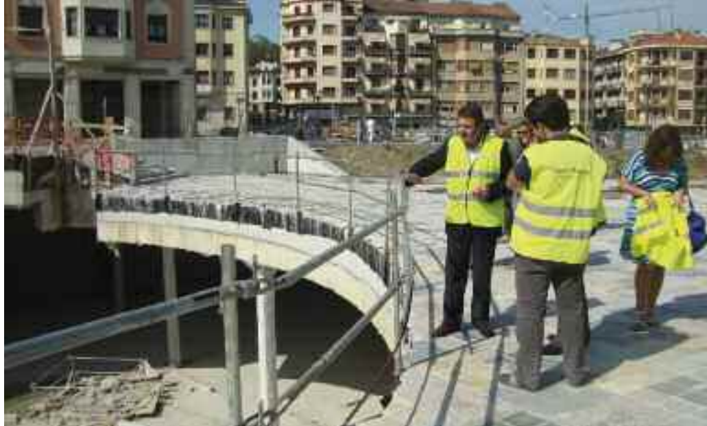
Alkatea, obren egoera ikusteko egin zuen bisita batean.

Behin San Juan plazako urbanizazioa amaituta, azken hiru hilabeteetan Etxeandia eremuko zolaketa eta lurrazpiko aparkalekua burutzea izango da helburua. Lur azpiko eraikinak hiru solairu ditu: lehenengoan liburutegia moldatuko da etorkizuneari; bigarrena txandakako aparkalekua izango da, eta hirugarrenean, plaza pribatuenak. Guztira 415 plaza izango dituen aparkalekuko sarbideak amaitzen ari dira, bai ibilgailuenak bai oinezkoenak. Solairu bakoitzak bere sarbideak izango ditu: pribatuenak, Prudentzia Arbidekoa eta Jenaro Etxeandiakoa dira, eta txandakakoarenak, gainontzekoak. Barne-instalazioak (megafonia, elektrizita-