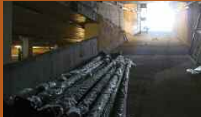
Aparkalekuaren sarbideetako bat.