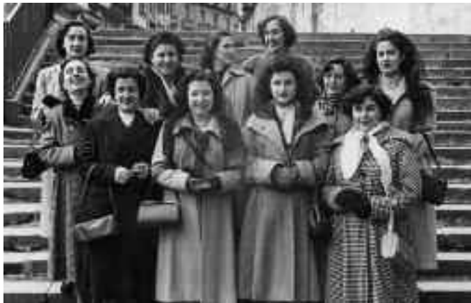
Iturria: Irungo Udal Artxiboa 25957