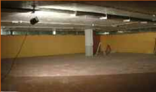
Txandakako aparkaleakua pintatzen ari dira jada.