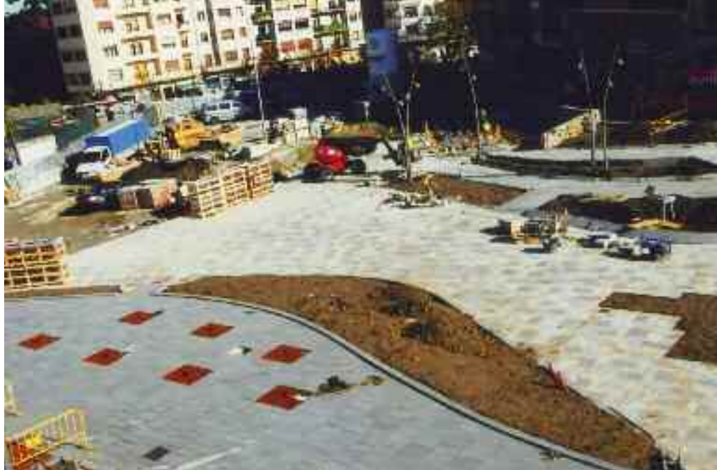
Plazako obrak, azaroan.