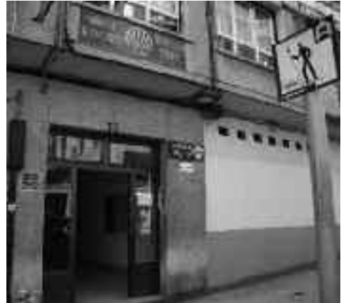
Irungo aterpetxea Lucas de Berroa kalean dago.

Iaz 3.624 errromesek ostatu hartu zuten aterpetxean. Txingudiko ordezkariak arduradunak 2011n kopuru hori gaindituko delakoan daude, iaz Konpostelar Urte Santua izanak ekarri zuen masifikazioa saihestu nahi zutenek aurten bidea egiteko erabakia har dezaketelako.