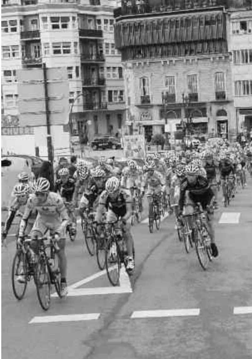
Bidasoa Itzulia, San Juan plazara sartzen.