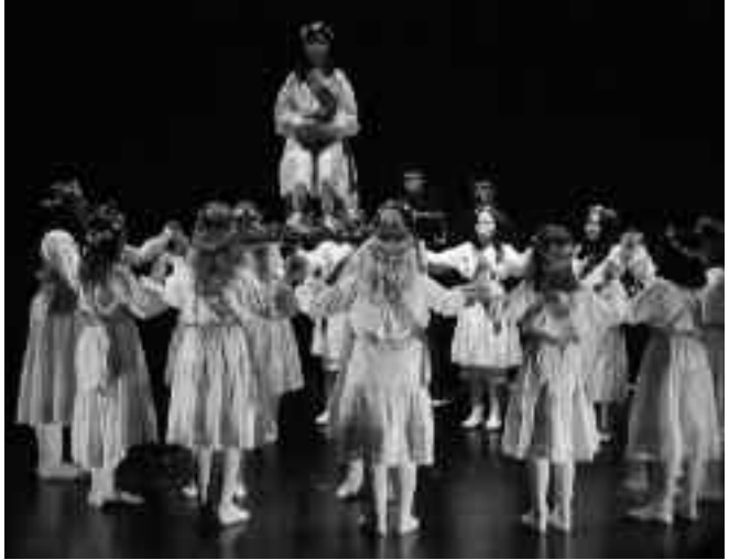
Adaxkako neska talde bat Amaiaiko saioan.

Agurrarekin hasi zen egitaraua hainbat bazterretako dantzek osatua izan zen: Berako eta Korteseko makil-dantzak, Lapurdiko polkak, zahagi-dantza, Imotzeko esku-dantza, uztai-dantzak, eta abar luzea. Dantzariak txalo zaparrada jason zuten egindako lan txukunaren sari.