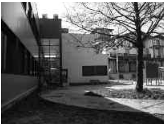
Mondragon Unibertsitateak 270 ikasle ditu.