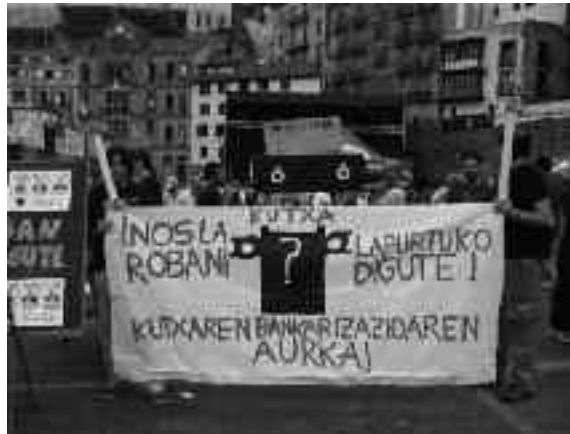
Donostian, Kutxaren bankarizazioaren aurkako protesta ekintza.