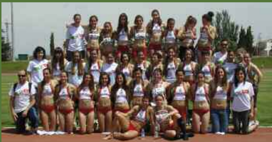
Goian, emakumezkoen talde absolutua; behean, gizonezkoena.