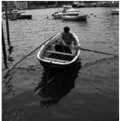
Goian, Maribeltz batela, zaharberritze prozesuan; behean, berritua.