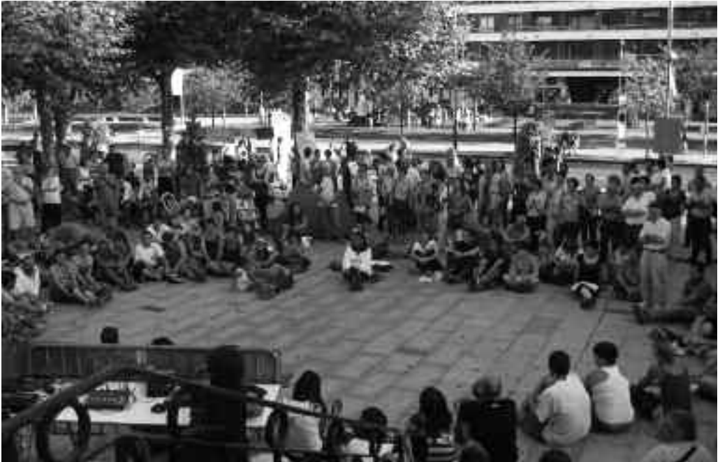
Bruselaraino iritsi zen martxa Irundik igaro zeneekoa, joan den abuztuaren.

Madrilen jaio zen M15M mugimenduari lotu zityaizkion; orduz geroztik, ostirale-ro biltzen dira Irungo Zabaltza plazan demokrazia loalditik esnarazteko xedez. Eskualdeko suminduen topagune den Bidasoako Kanpaldia abian da.