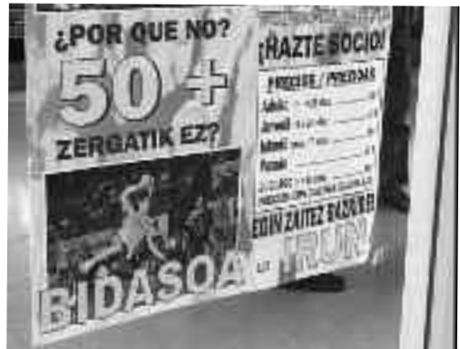
Goian, 50. urtemugako programa antolatuko duen batzordea; behean, bazkide kanpainaren kartela.

Espainiako Eskubaloi Federazioarekin harremanetan jarri gara selekzioak Artalekun partidu bat joka dezala proposatzeko. Ezinezkoa balitz, partidu garrantzitsu bat nahi genuke; esaterako, Madrilgo Atletikoak parte hartuko lukeen norgehiagoka bat. Bestetik, jokalariek jantziko duten 50. urtemugako kamiseta prestatzen ari gara. Gainera, kontzertu bat antolatu nahi dugu, eta saltokiek emandako produktuekin zozketa bat egin.