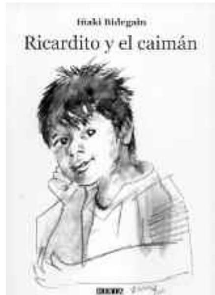
Liburuaren azala. Ilustrazioak Rafael Munoarenak dira.