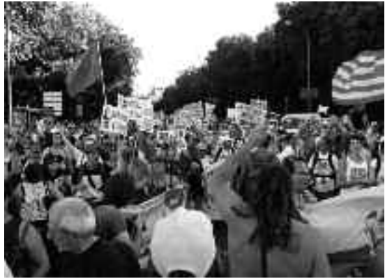
Irungo M15M mugimenduko kideak Madrilan, ekintza batean.