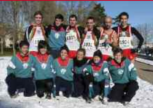
Kross taldea Gasteizen.