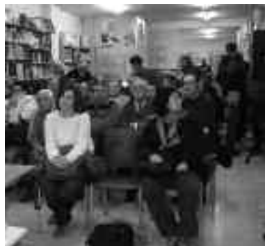
Larreaundin egin zen bilera.

Aurreneko bilera Larreaundin burutu zen joan den abenduaren 1ean.