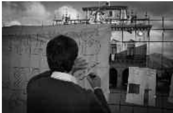
Bidasoako suminduen ekintza bat, San Juan Harria plazan.