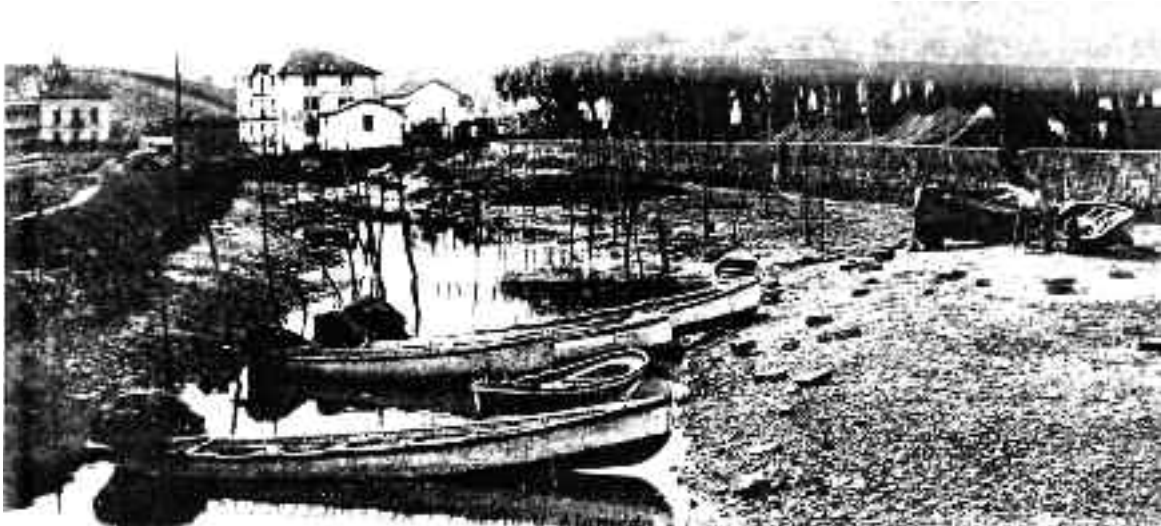
Ubarikak Hondarribiko Alamedan.