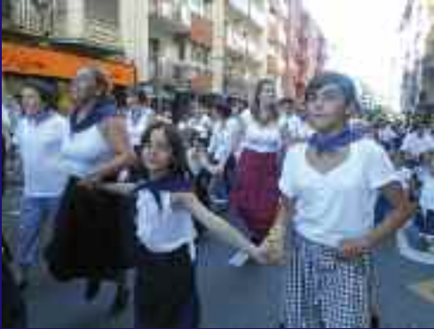
Primerako eguraldiak festaz gozatzeko aukera pare-gabea eskaini zuen.