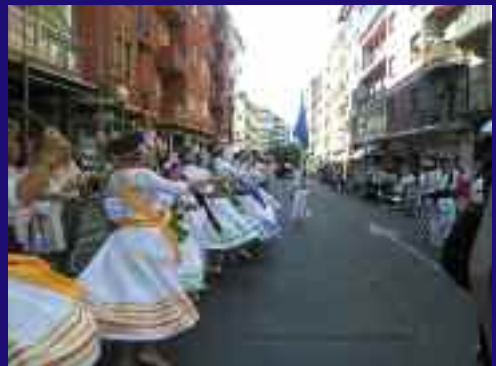
Hendaiaiko gurdiaren atzetik, Lapurdiko dantzak, Lekorneko taldearen eskutik.