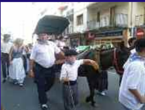
Haurrak ez ezik, edari sorta ederra zeraman astoak kalesan, beroari aurre egitea ezinbestekoa baitzen!!