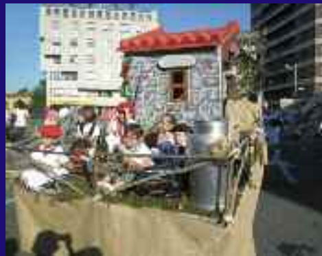
Kemen Dantza taldekoek, dantzak bizi duen sasoi ona erakusteko, erromeria egin zuten.