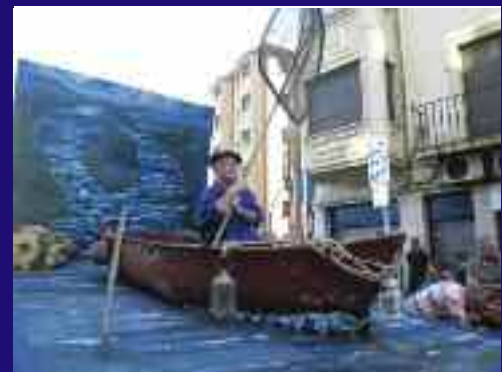
Hirukanale inguruan ohikoa zen jendea angula bila ibiltzea. Hori izan da Santiagokoan aurtengo lana.