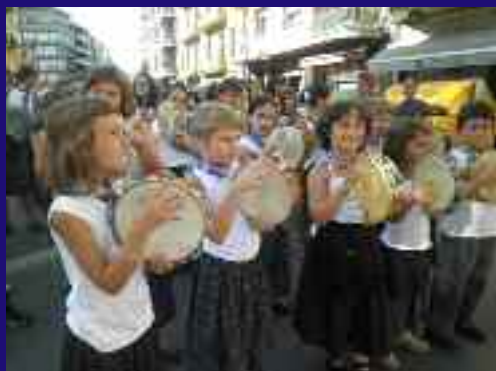
Euskal Kirolak girotuz, Lesakako trikitilariak joan ziren.