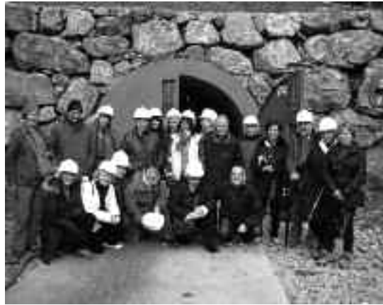
Mintzalaguna egitasmoko zenbait parte-hartzaile, Arditurriko meategietara txangoa egin zutenean.

Halaber, hizkuntzaren erabilera sustatzeko hainbat ekintza osagarri burutu dira; hala nola, irteerak eta tailerrak.