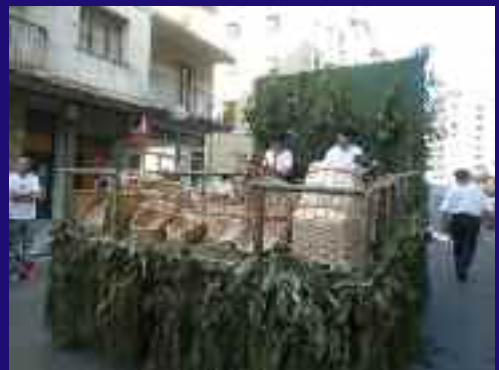
Euskal Kirolak taldearen gurdian, saskigileak lanean aritu ziren.