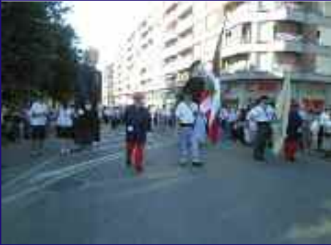
Desfilearen buruan, mikeleteak eta erraldoiak.