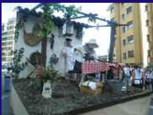
Ezkerrean, dantzari bat. Eskuinean, Anakako hiru elkarteren gurdia. Baserriko jardueretako bat aukeratu zuten: odolkgintza. Txerria hil ondoren hainbat jaki prestatzen dira. Horietako bat da odolki goxoa.