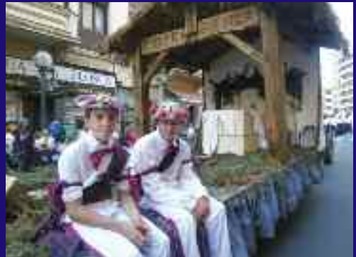
Urtero legez, Hendaiaiko Euskal Jirako gurdi batek parte hartu zuen.