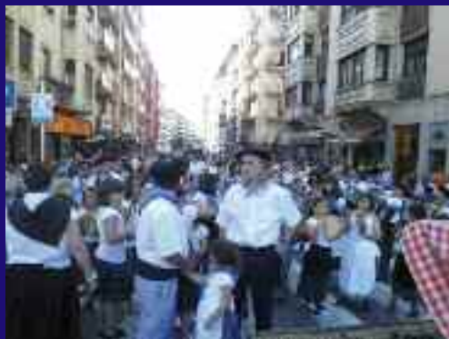
Anakako elkarteek jendetza bildu zuten. Aurretik Auntxakoak zihoazen, musika jotzen. Ez zuten etenik!