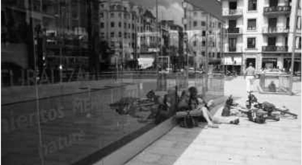
Turista finlandiar bikote bat Irungo bulegoan, informazioa bildu ondoren.