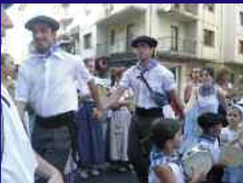
Ohiko euskal giroak Irungo kaleak alaitu zituen.