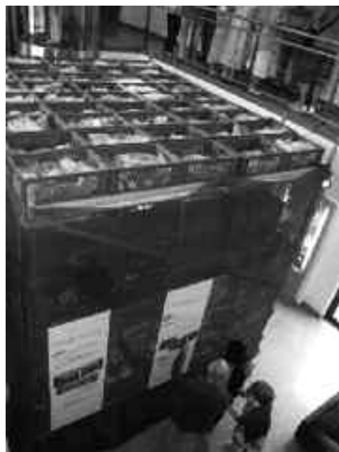
Oiasso Museoa jarri den aldamioren gainean ikusgai diren aztarnak.