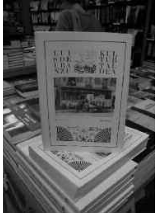
LUKTen aldizkari berria salgai dago kioskoetan eta liburu-dendetan.