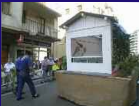
Behobikoek auzoko trinketea irudikatu zuten, Irungo zaharrena (1934), hain zuzen.