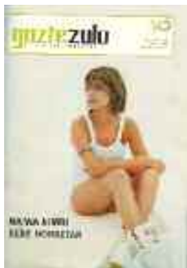
Gaztezulo aldizkaria GIBen da.

Euskal Kultur Erakunde lan egitera abuztuaren 16a baino lehen.