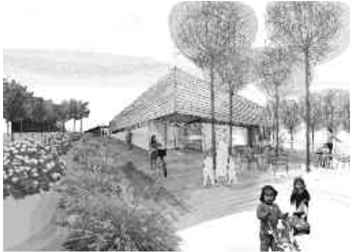
Eraikinak zur naturaleko oholetadura izango du goiko aldean.

Parkearen barnean, idatzitako proiektuak oso kontuan eduki behar izan du kokalekua, baita