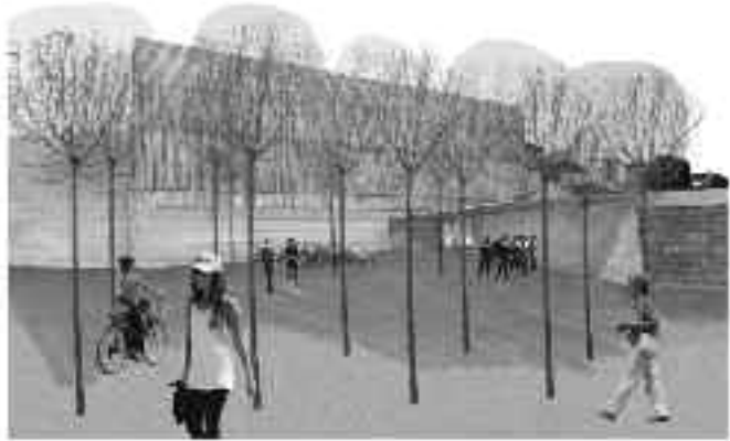
Teknifikazio Zentroaren eraikinaren inguruan egoki txertatuta egongo da.