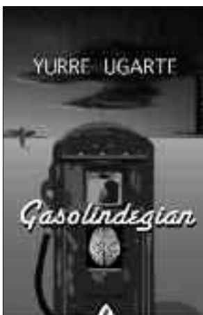
Liburua: Gasolindegian Egilea: Yurre Ugarte Argitaletxea: Alberdania

Liburua Bidasoan hasi eta Bidasoan amaitzen den emaria dela esan dut. Zazpi errekastok osatutako ibaia. Hori nire koadro/iruzkin honen metafora txikia da. Liburuaren metaforaren arabera, bigarren atalean edo errekastean protagonista agertzen da, istorioaren kontalaria. Koadroak maite dituen pertsona dugu, pertsona fantastikoa edo margolaria. Rut Purrut goitizena du. Koadroaren hurrengo ekarrietan, errekastotan, espazioak eraiki eta pertsonaiak nahasten