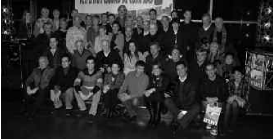
Saridun guztiak.

Irungo Merkatarien Elkartek, MUGANek, Irungo Hiri Merkataritza-Merkagune sariak banatu zituen, joan den azaroaren 27an antolatutako ekitaldi berezian.