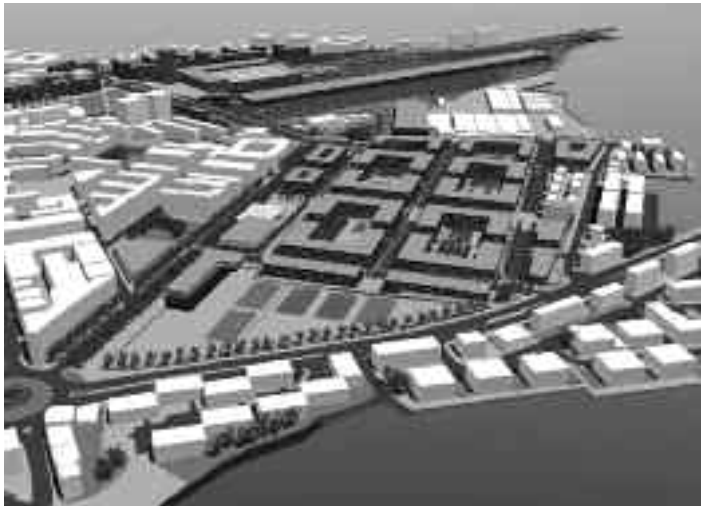
San Migel-Anakako eremu berriaren maketa.