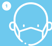
BETI MASKARA JARRI UTILIZA SIEMPRE MASCARILLA