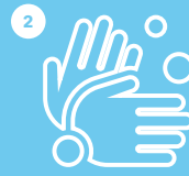
HIGIENE-NEURRIAK BETE CUMPLE CON LAS MEDIDAS DE HIGIENE