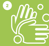
HIGIENE-NEURRIAK BETE CUMPLE CON LAS MEDIDAS DE HIGIENE