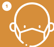
BETI MASKARA JARRI UTILIZA SIEMPRE MASCARILLA