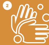
HIGIENE-NEURRIAK BETE CUMPLE CON LAS MEDIDAS DE HIGIENE