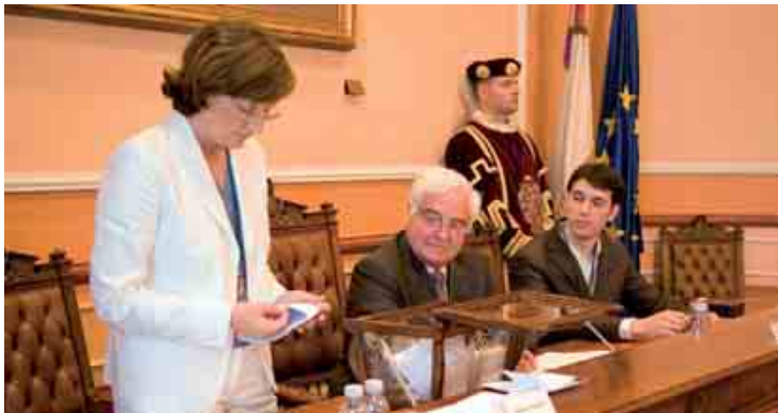
■ La Secretaria General efectúa el recuento de votos para la elección de alcalde.