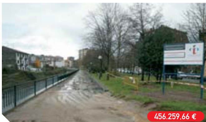
Elizatxo eta Palmera Monteroko bidegorriaren artean bizikleta-errea jartzea Implantación del carril bici entre Elizatxo y el bidegorri de Palmera Montero