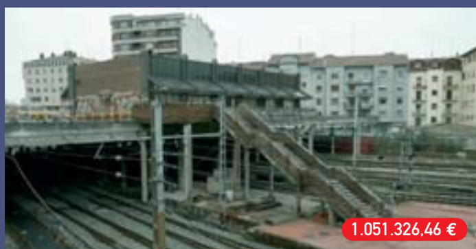
Txanaleta plazaren urbanizazioa eta Renferako sarrera-irteerako eskailera mekanikoak Urbanización plaza Txanaleta y escaleras mecánicas de acceso a Renfe