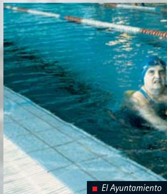
■ El Ayuntamiento

El CDN Bidasoa XXI se creó como tal en 2001, aunque muchos de sus integrantes comenzaron a trabajar por la natación en la comarca muchos años antes en el seno de la sección de natación del CD Bidasoa. En su vertiente deportiva es un club que ha cosechado importantes éxitos en competiciones de Euskadi y de España y que ha favorecido la práctica de este deporte en la ciudad con un aumento paulatino, año a año, del número de socios.