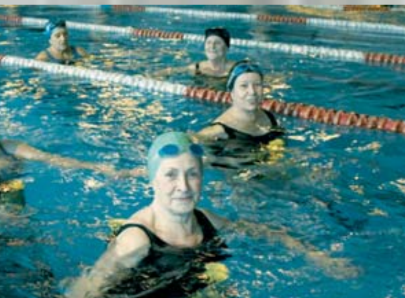
persigue fomentar la práctica deportiva entre toda la población