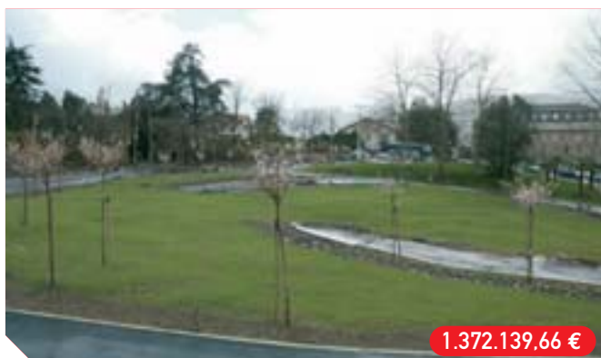
Alai-Txoko parkea gauzatzeko Ejecución Parque Alai-Txoko