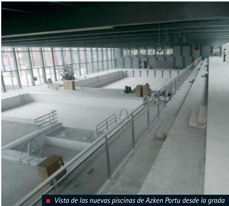
■ Vista de las nuevas piscinas de Azken Portu desde la grada

Azken Portu está llamado a convertirse en un centro que potencie el deporte, el ocio y la convivencia y constituirá uno de los equipamientos públicos más importantes de la ciudad. El proyecto contempla la realización de la instalación en dos fases, la primera de las cuales es ya una realidad y entrará en funcionamiento el próximo mes de mayo.