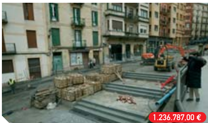
Urbanizazioa Eskoleta karrika Urbanización c/ Escuelas