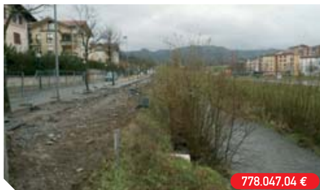
Artiga ibilbidea berriz urbanizatzea Reurbanización del paseo Artiga