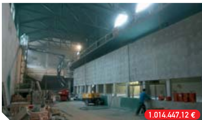
Artia Trinketea Trinquete Artia