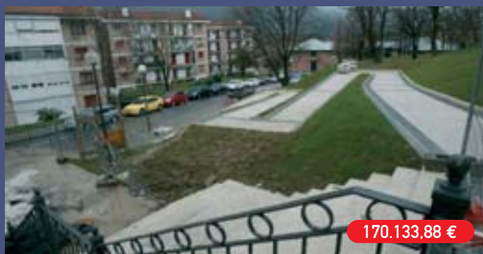
Errotazarreko (Katea) oinezkoentzako sarbideak Accesos peatonales a Errotazar (Ventas)