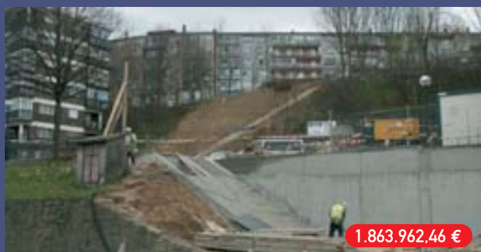
Artia-Azken Portu bizitegi gunearen oinezkoentzako konexioa Conexión peatonal zona residencial Artia-Azken Portu