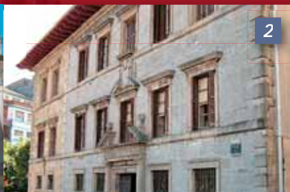
Arbelaitz Jauregia Palacio Arbelaiz