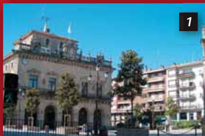
Udaletxea eta San Juan Harria Casa Consistorial y San Juan Harri