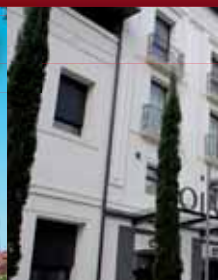
OIASSO Museoa Museo OIASSO