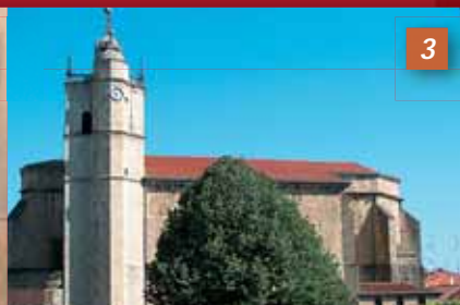
Junkaleko Amabirginaren Eliza Iglesia de Ntra. Sra. del Juncal