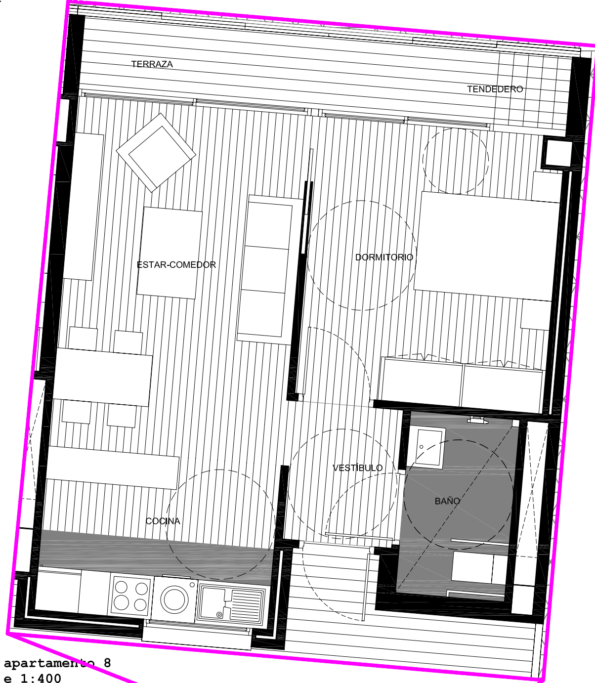
apartamento 8 e_1:400