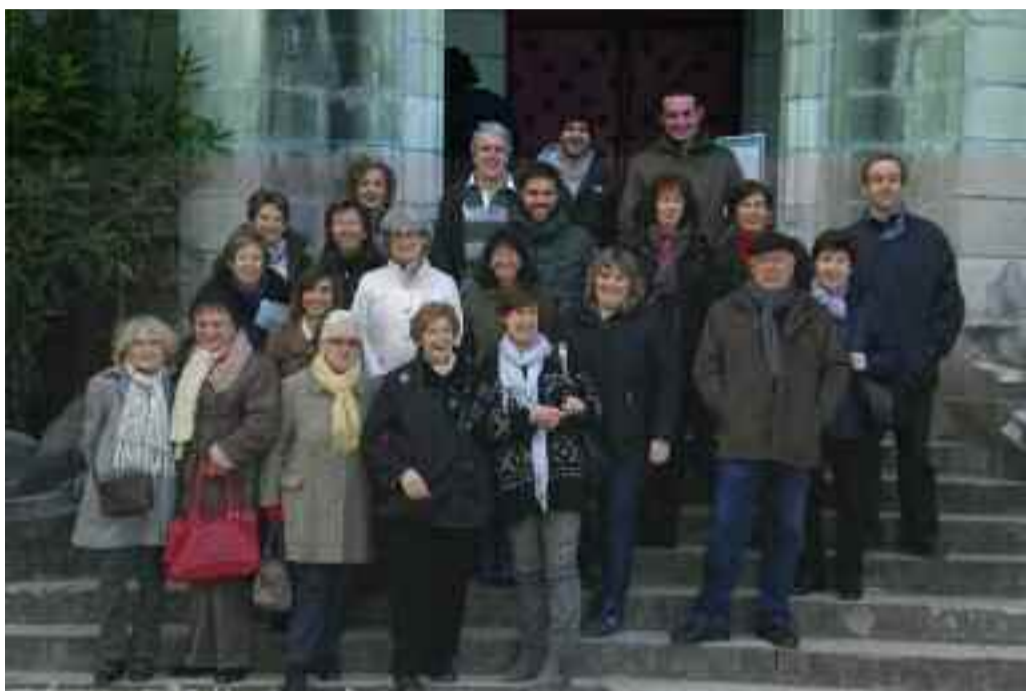
Frantsesa ikasten ari den talde bat Abbadiako gazteluan.

Taldean azterketak jomuga dituztenak badaude, baita garai batean hitz egiten zutenak baina gaur egun, inguru erdaldunaren eraginez, ezin erabiliz dabilzanak ere.