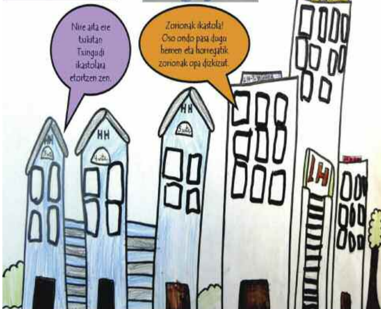
Goiko marrazkiaren egilea: Oier Rios (2. A). Eskuinekoa 5. Fko ikasleen lana da.