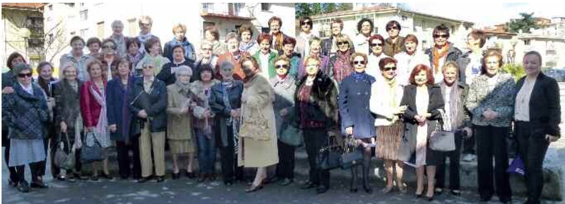
Bazkide taldea, Emakumearen Astea dela-eta aurten egin duten ekitaldi batean.