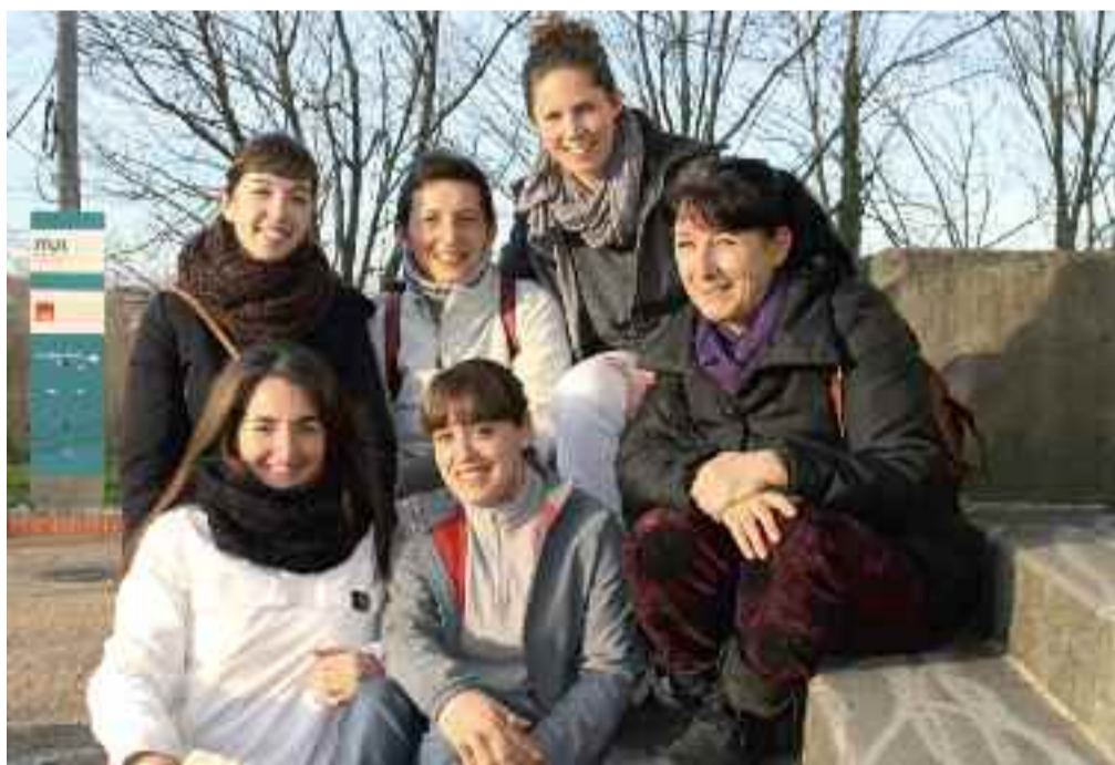
Euskarazko taldeko zenbait kide