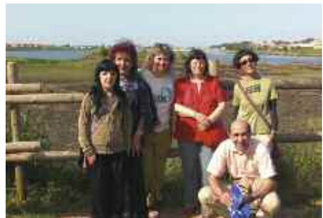
Iazko esperientzia pilotuko partaideak Plaiaundi bisiatu zutenean.