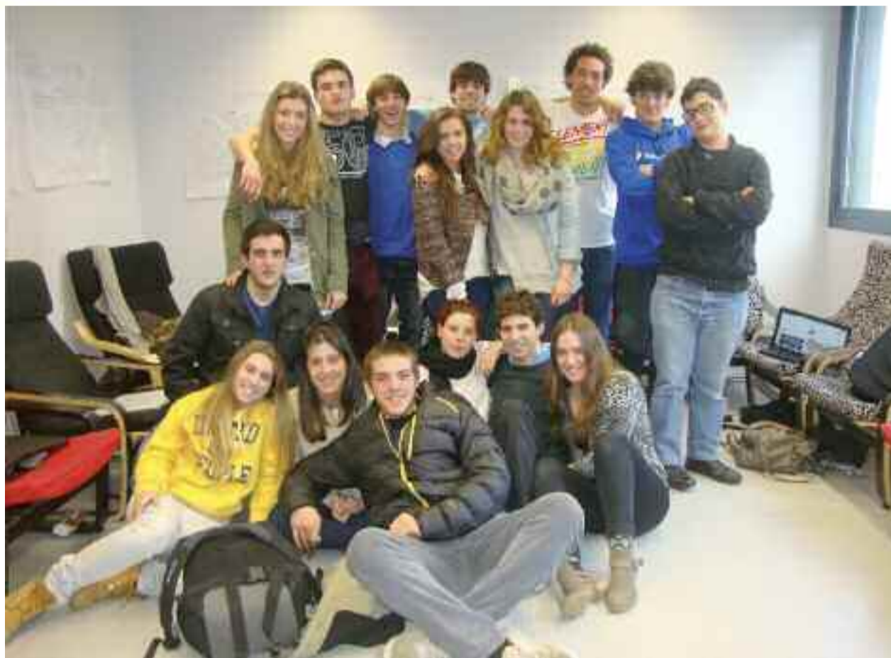
Lidergo Ekintzaile graduiko ikasle talde bat.