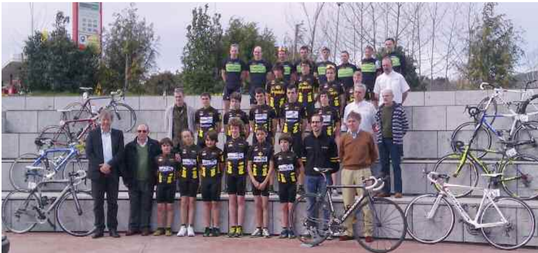
Irungo Txirrindulari Elkarte taldeen 2013ko denboraldirako argazkia.