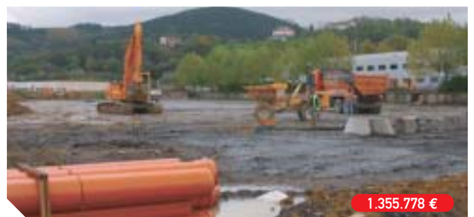
Instalaciones deportivas de Ugalde-Ventas