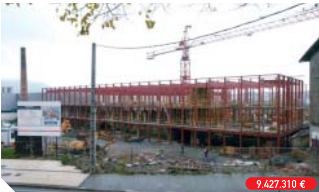
Ejecución 1ª fase de las instalaciones deportivas de Azken Portu