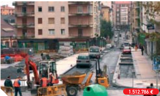
Urbanización de la calle Aduana