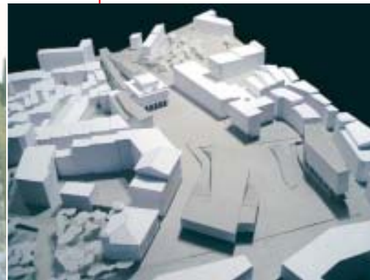
P.3 LUGARES COMUNES