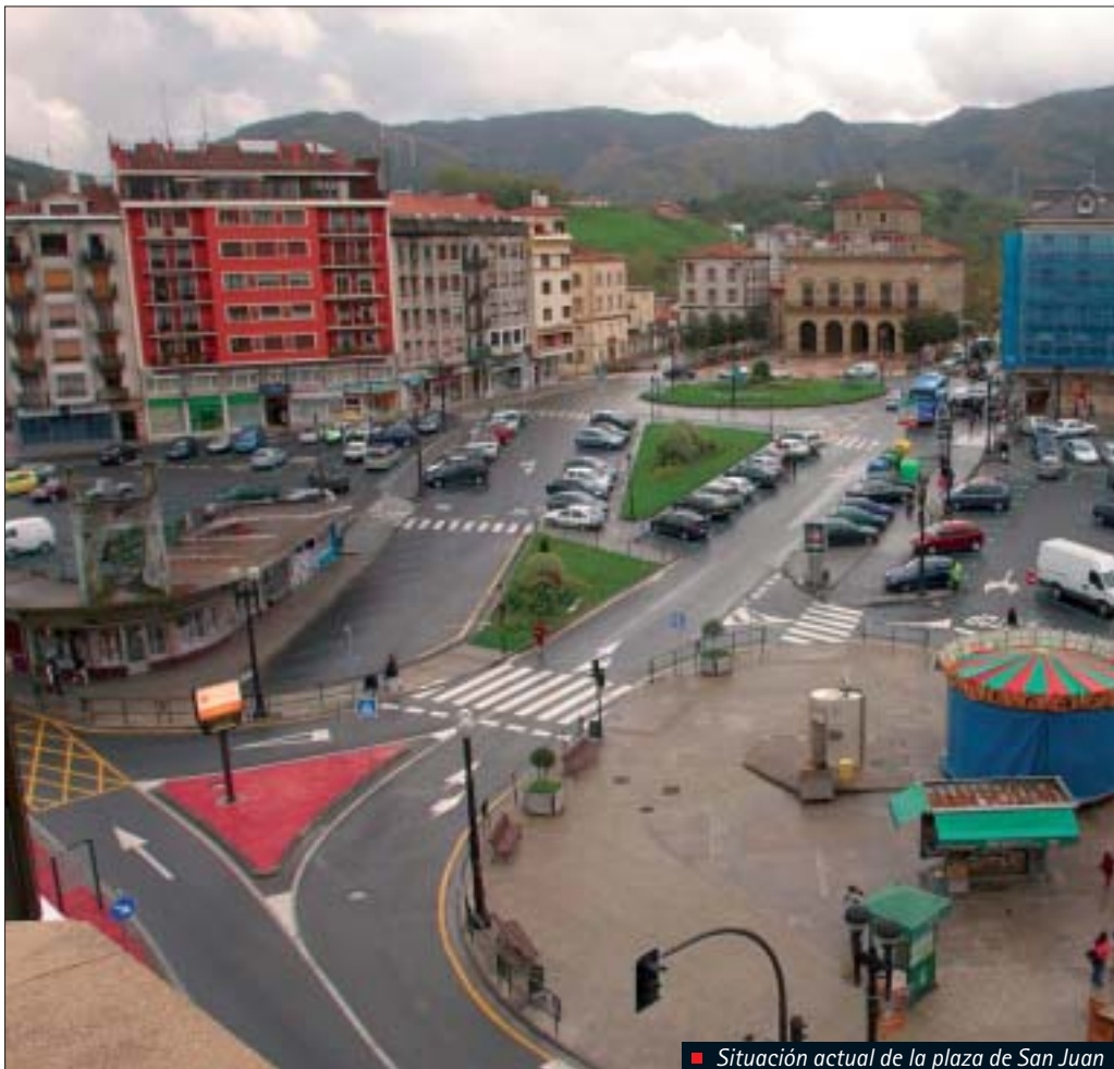
■ Situación actual de la plaza de San Juan

San Juan plazan abenduaren 1etik 20ra bitartean Alderdi Ofiziala izeneko birmoldatzeko aurkeztu diren hiru proposamenen erakusketa izango da, proposamen horiek Ideien Nazioarteko Lehiaketan aukeratu dira, azkeneraino erabakigarria izango den herritarren partaidetzako prozesu baten barruan Udalak egindako deialdian. 16 urtetik gorako irundar guztiak parte hartu ahal izango dute hiriaren erdialdea izango dena taxutuko duen behin-betiko ideia aukeratzeko orduan.