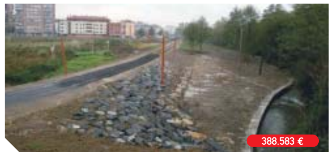
Encauzamiento regata de Artía y diseño del parque Arbesko errota