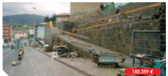
Mejora de accesos peatonales a viviendas en Prudencia Arbide