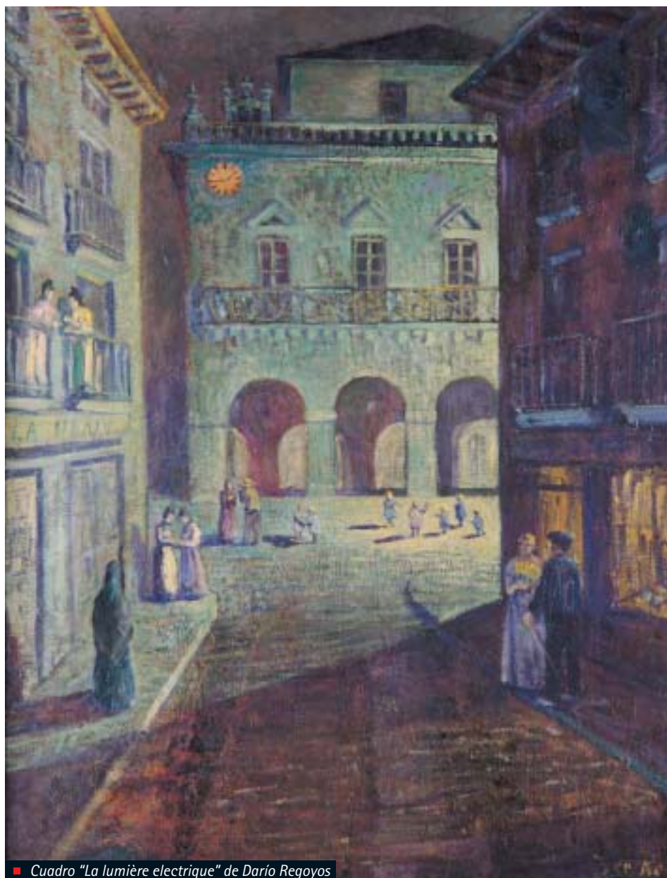
■ Cuadro "La lumière électrique" de Darío Regoyos

Ideien Lehiaketa irabaziko duen ideia aukeratzeko prozesuan parte hartu nahi duten herritarrek honako baldintza hauek bete beharko dituzte: bozketa egiten denean hirian erroldatuta egotea eta 16 urtetik gorazatea. Nortasuna egiaztatu beharko dute agiri baten bidez (NAN, gidabaimena edo pasaporte) eta egokiena iruditzen zaien aukera hautatu ukipen-pantaila batean sakatuz. Aukera ezin hobea da azken erabakian irundarrek beren iritzia emateko.