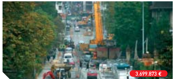
Urbanización y colector Avda. Iparralde