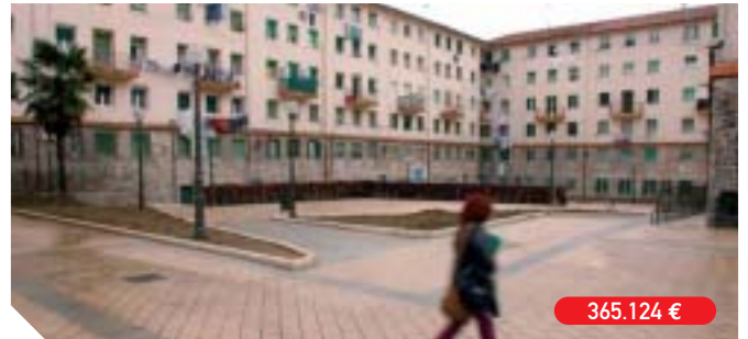
Urbanización de la plaza del Grupo Juncal