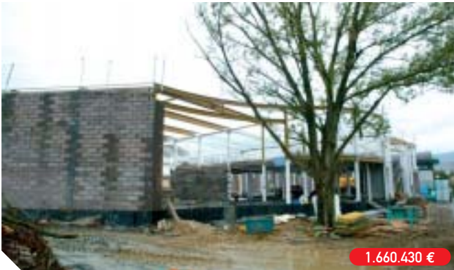
Proyecto de nuevas instalaciones de remo y piragüismo (1ª fase)