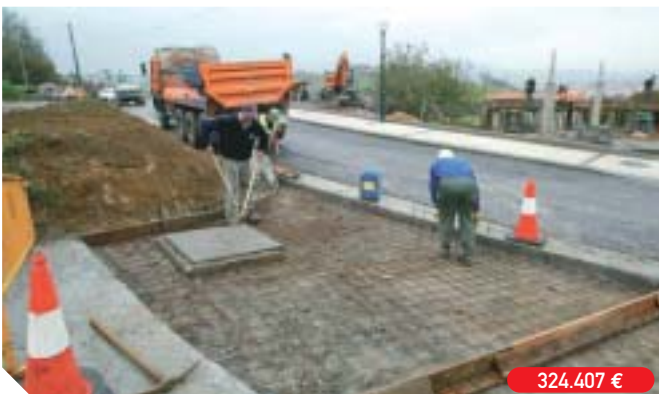
Urbanización de Ernauteberri (Behobia)