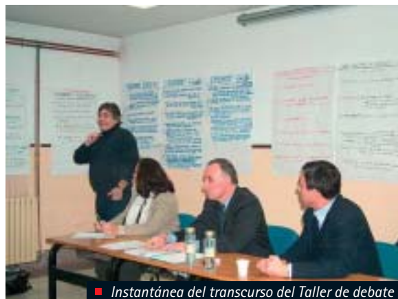
Instantánea del transcurso del Taller de debate

El Jurado Calificador que ha efectuado la pre-selección de las ideas finalistas, ha invertido, aproxi-