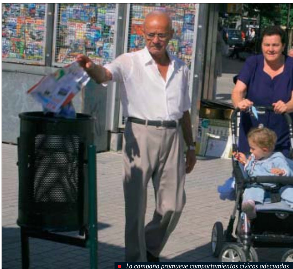
■ La campaña promueve comportamientos cívicos adecuados

Los soportes de la campaña de sensibilización son, entre otros, folletos informativos, banderolas, anuncios para marquesinas, anuncios de televisión y cuñas de radio. Además, con motivo del programa se han editado otros materiales de difusión, como bolígrafos, camisetas y pegatinas para los comercios que se adhieran al Manifiesto.