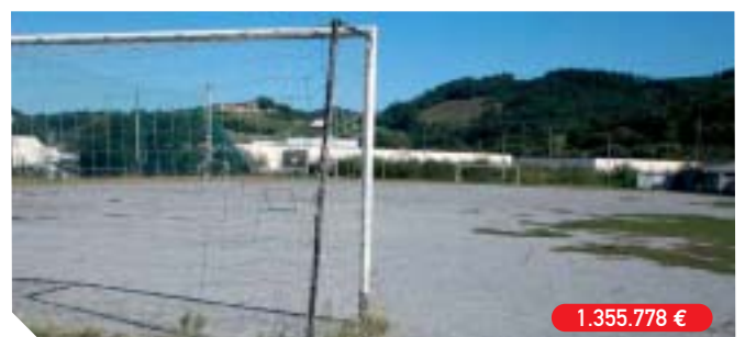
Construcción de un campo de fútbol en Ugalde-Ventas