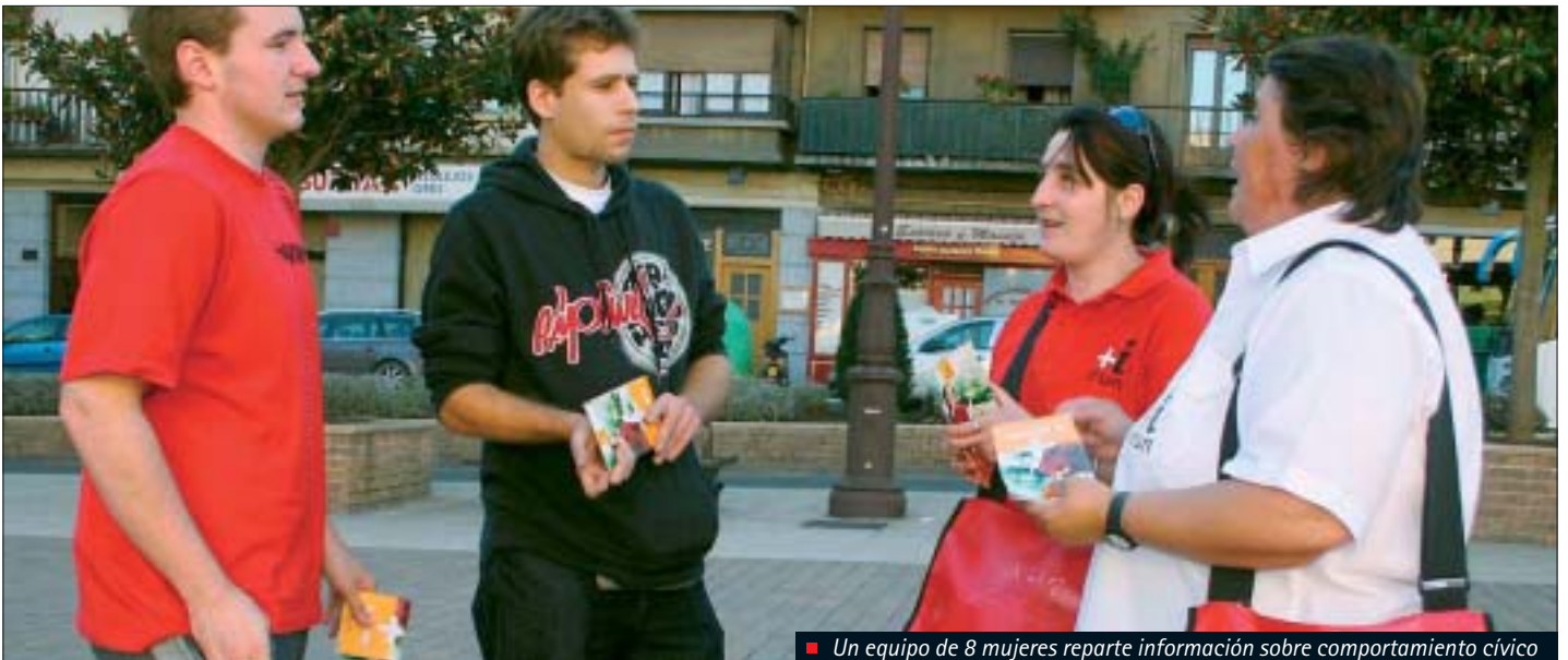
■ Un equipo de 8 mujeres reparte información sobre comportamiento cívico

Udalak "Irun gizalegez" kanpaina aurrera darama errespetuan eta tolerantzian oinarritutako bizikidetzaren bul-tzatzearen, ondasun publiko, hiri altzari eta komunitateko ekipamenduen erabilera zuzena lortzearen irun-darren indarrak batzeko. Programak, oinarritzat Gizalegezko Jokabideari buruzko Ordenantza duelarik, "Irun gizalegez" kanpaina osatzen duten gaiak garatzerakoan juridikoki antolatzeko bereziki sortu zena, hiru jar-dunbide dauzka: Gizalegearen aldeko Manifestua, gizalegearen alorreko agente talde bat eta sentsibilizazio kanpaina bat.