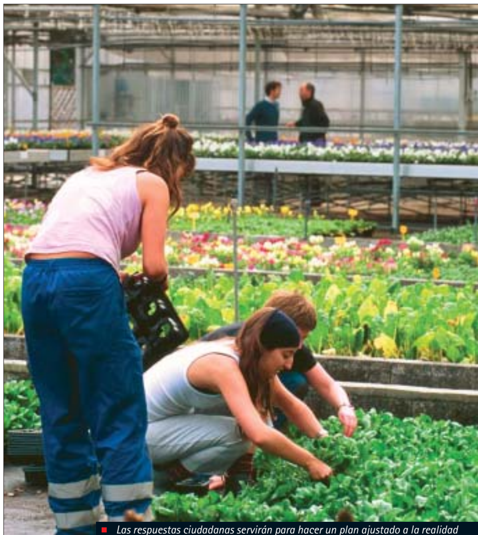
■ Las respuestas ciudadanas servirán para hacer un plan ajustado a la realidad

El diagnóstico continuará en noviembre y diciembre con el análisis de las acciones realizadas por las diferentes áreas municipales y otras entidades sobre