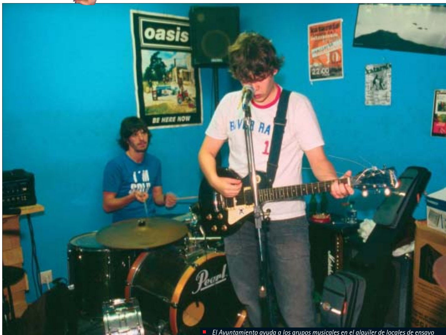
■ El Ayuntamiento ayuda a los grupos musicales en el alquiler de locales de ensayo

Udalak gazteen ekintza desberdinak sustatu edo laguntzen ditu, eta urte osoan zehar milaka gazte biltzen dira ekintza horien inguruan. Guztien artean azpimarratzekoa da musika taldeentzako entseugarako lokalak alokatzea, denbora libreko taldeen artean ekintzak antolatzea, Zine Klubaren saioak, Bidasoako Gazteen Folklore Jaialdia, Gazte Antzerkiaren Erakustaldia eta Gazteen Zinema eta Bideo Lehiaketa. Horri gehitzen zaizkie Martindozenea Gaztelekuan antolatzen diren ekintza desberdinak, adibidez, tailerrak eta erakusketak.