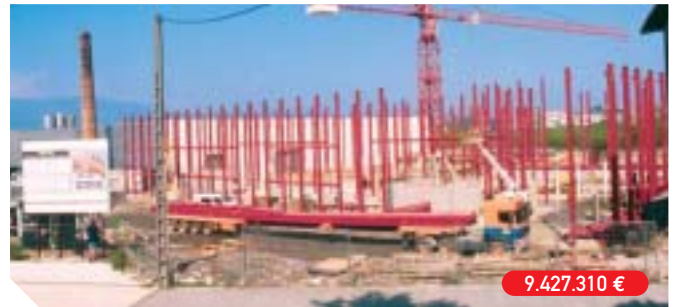
Construcción de la 1ª fase de las instalaciones deportivas de Azken Portu