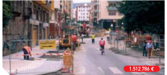
Reurbanización de la calle Aduana