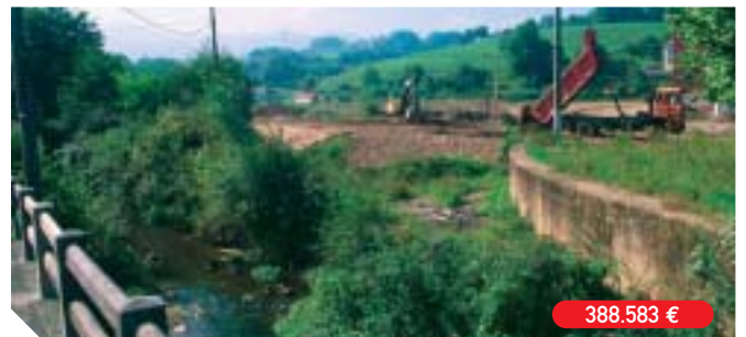
Encauzamiento de la regata de Artia y diseño del parque Arbesko Errota