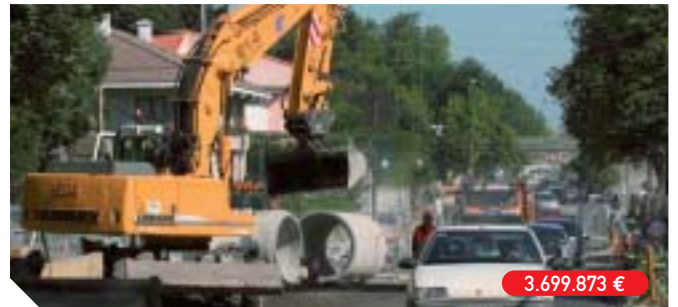
Reurbanización y colocación de un colector en la Avenida de Iparralde