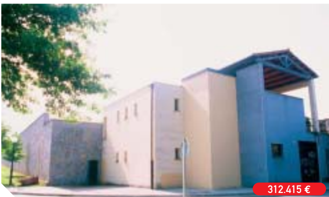
Reforma del edificio de nichos en el cementerio