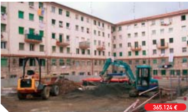
Reurbanización de la plaza situada en las viviendas Grupo Juncal