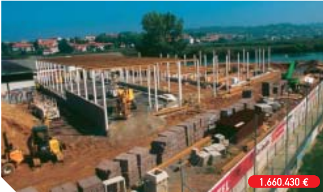
Nuevo pabellón de remo y piragüismo, junto al Stadium Gal