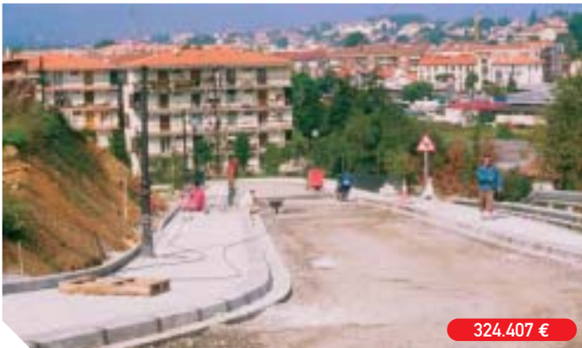
Urbanización de la zona de Ernaute-Berri, junto a Zaisa III