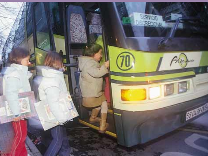
■ Las becas al transporte benefician a 148 estudiantes.