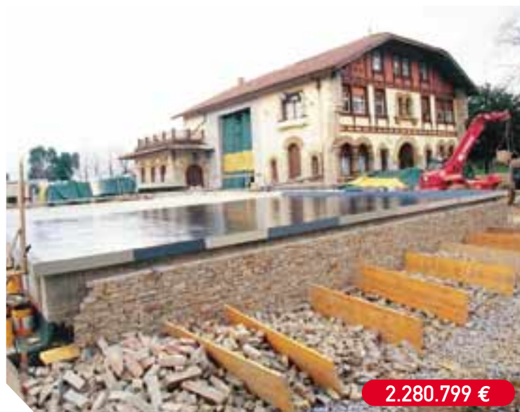
Ampliación del Conservatorio Municipal de Música