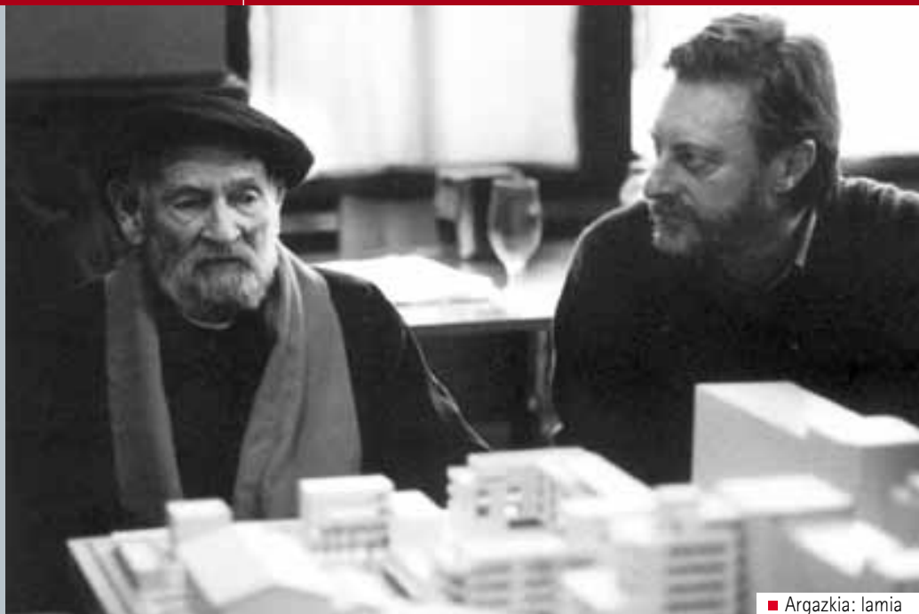
■ Argazkia: lamia