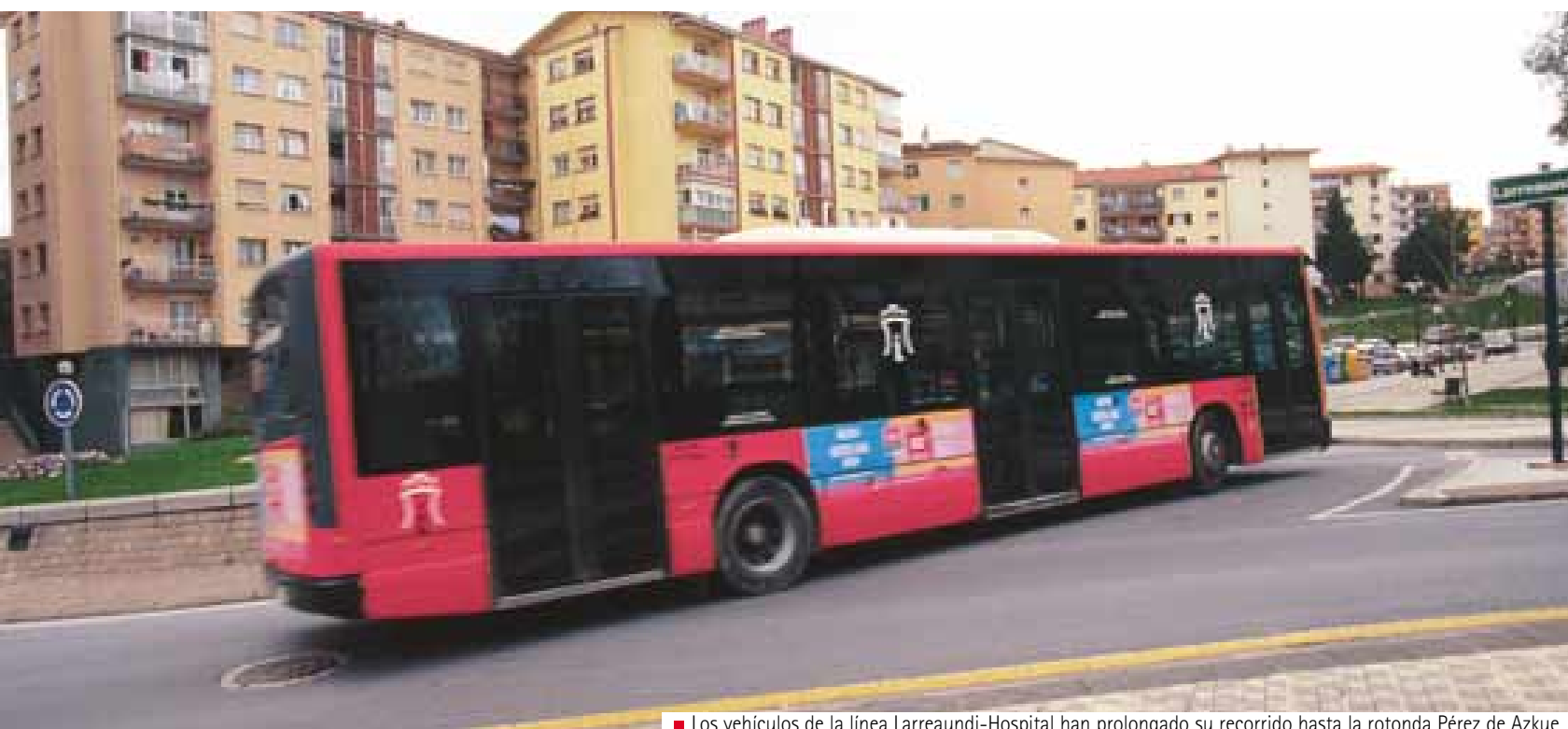
■ Los vehículos de la línea Larreaundi-Hospital han prolongado su recorrido hasta la rotonda Pérez de Azkue.

El transporte público urbano es una de las preocupaciones del Ayuntamiento que seguirá trabajando para mejorar la calidad de un servicio cada vez más utilizado por los ciudadanos.