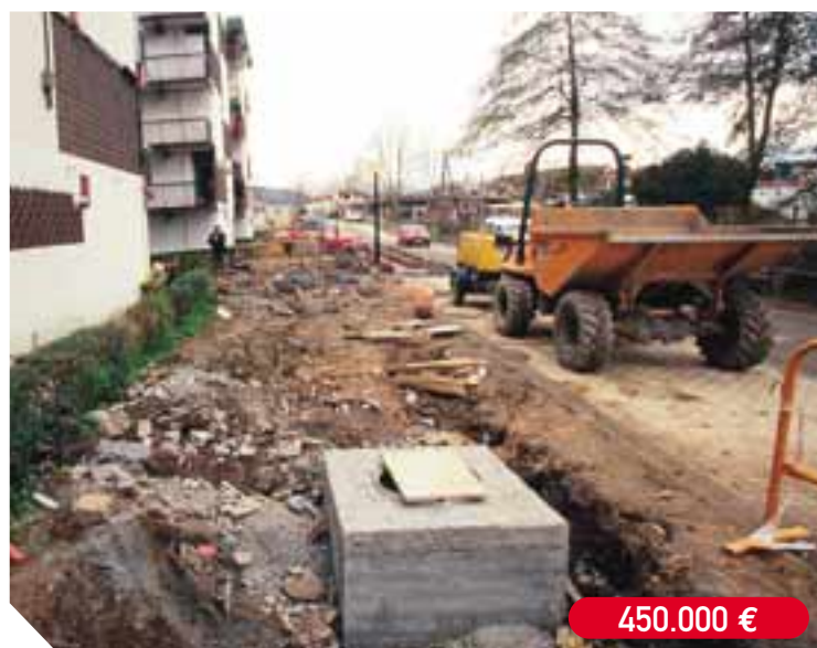
Urbanización de la zona de Mendipe, en el barrio de Behobia