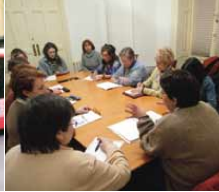
EMAKUMEEN LITERATURA 12