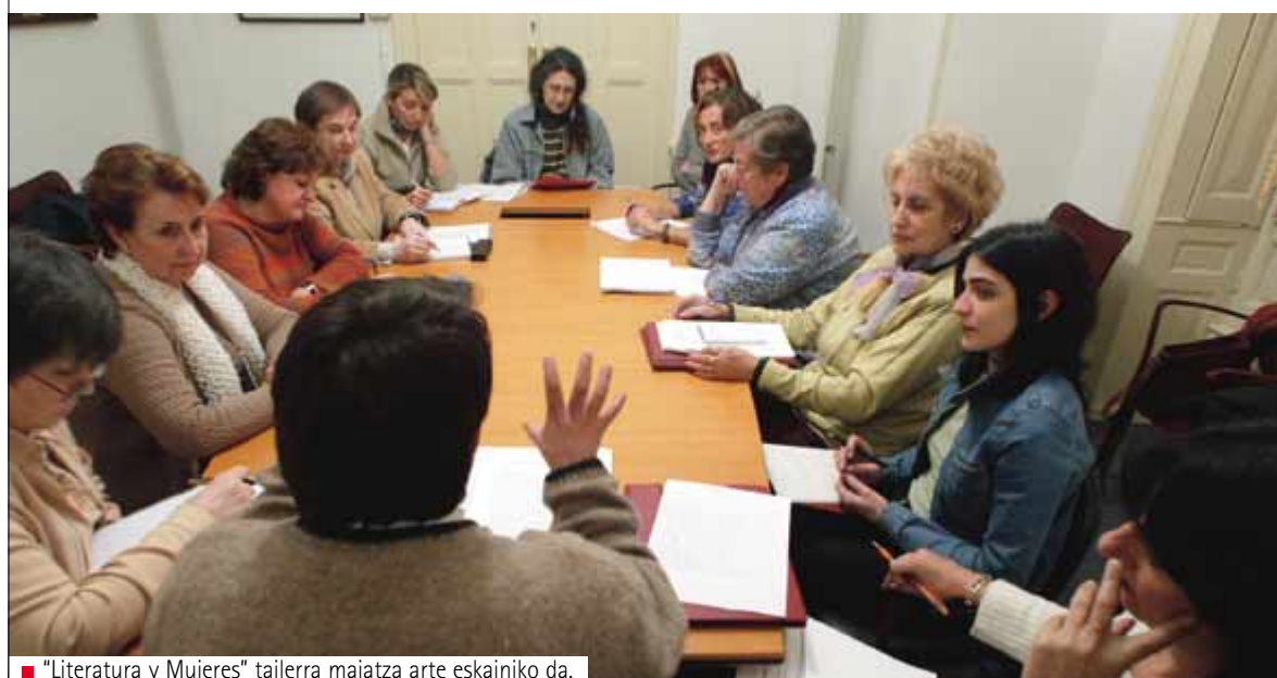
■ "Literatura y Mujeres" tailerra maiatza arte eskainiko da.

Tailer honetan bi maila bereizi dira, saioak aztergai duen mendearen arabera: I. maila, XVIII. mendeari dagokiona, eta II. maila, XIX eta XX. mendei dagokiena.