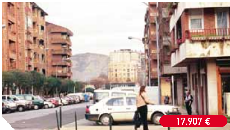
Instalación de nuevo alumbrado en la calle General Bergareche (Próxima ejecución)