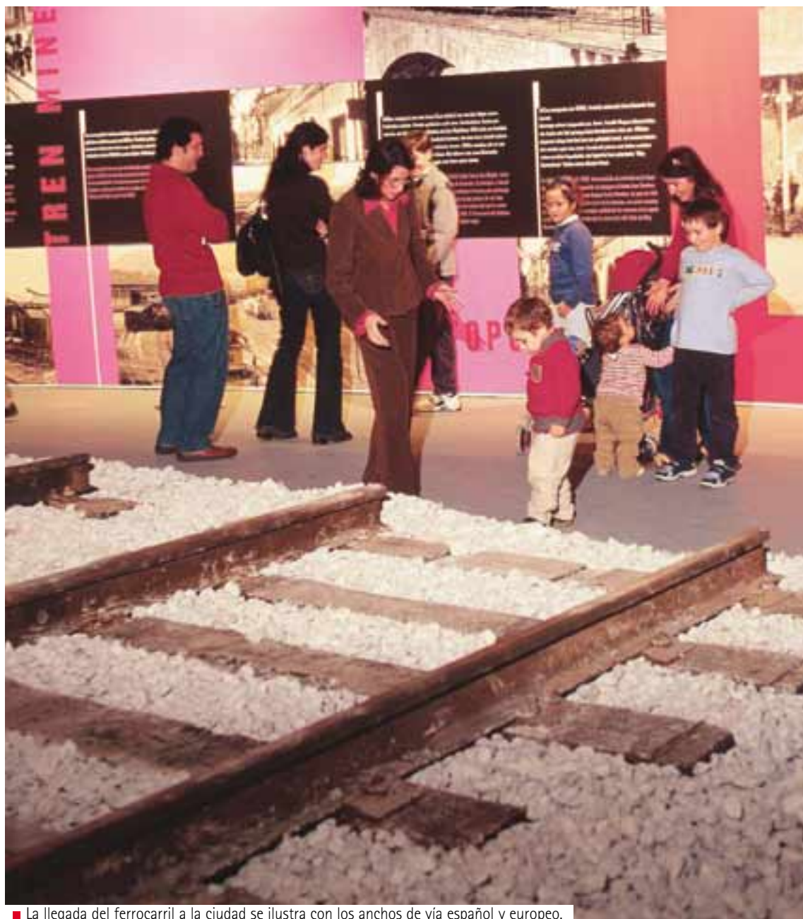
■ La llegada del ferrocarril a la ciudad se ilustra con los anchos de vía español y europeo.

FICOBaren lehenengo eta bigarren pabilioietan "Irun hirugarren Milurtekoari begira" erakusketa egongo da ikusgai otsailaren 8 arte; hiriaren azken 20 mendei buruzko ikuspegia eskaintzen du erakusketa horrek. Instalazioak dituen 2.500 metro karratuetan zehar hedatzen da erakusketa eta Irungo Udalak antolatu du, Kutxaren laguntzarekin. Erakusketak eskaintzen duen ibilbidean zehar era guztietako elementu, baliabide eta xehetasunak ikus daitezke, tokiko historiaren alderdiren batekin lotuak guztiak ere. Hiriak gizarte, kultur, politika eta ekonomia mailan izan duen bilakaeraren ikuspegi bikaina eskaintzen digu, beraz, erromatarren garaitik hasi eta gaur egun arte, etorkizuneko proiektuak ere aipatuz.