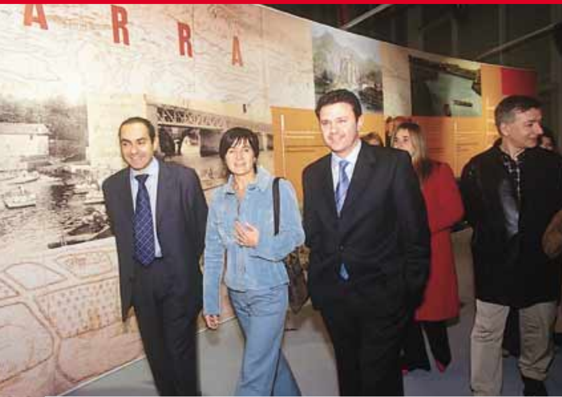
■ El alcalde de la ciudad -José Antonio Santano- acompañado de otros corporativos y responsables de la exposición.