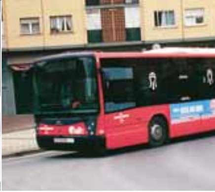
TRANSPORTE URBANO 10