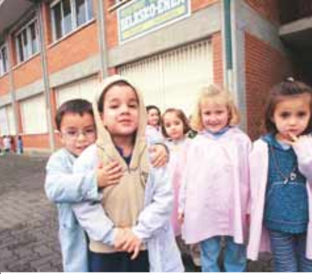
IMPULSO A LA EDUCACIÓN 6