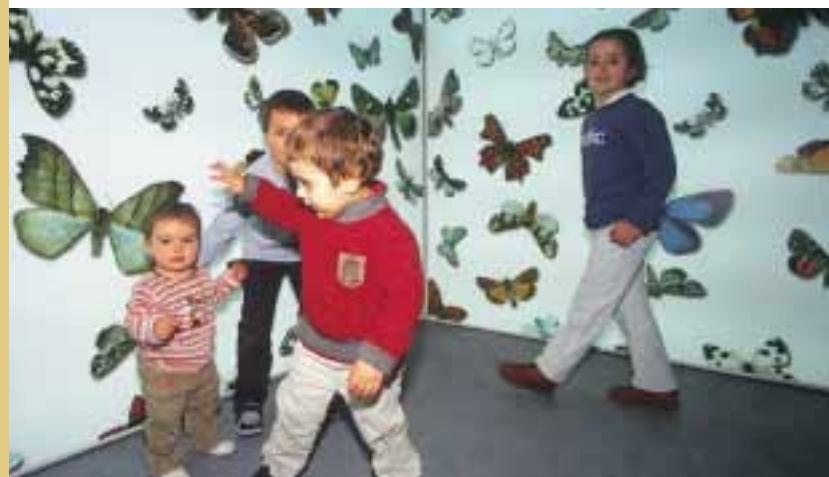
■ La exposición recoge una muestra de "Mariposas del Mundo".

Así, la exposición, didáctica y fácil de recorrer, se ha estructurado en seis secciones interrelacionadas y englobadas en los epígrafes: Iru-