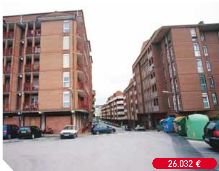
Colocación de nuevas farolas en la calle Hendaia (Próxima ejecución)