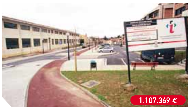
Urbanización de la calle Auzolan, situada en el Alto de Arretxe