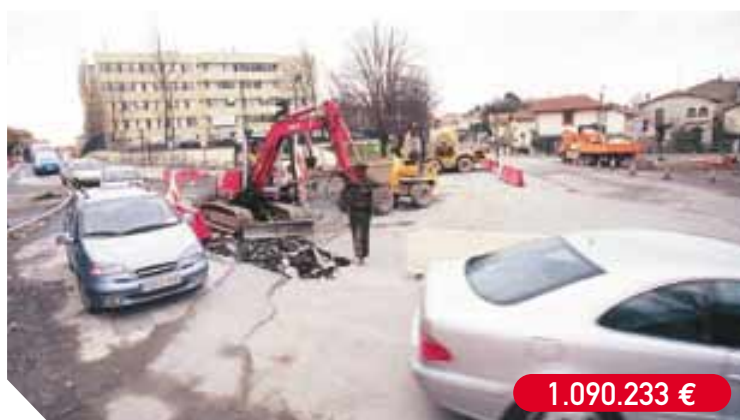
Reurbanización de la avenida de Elizatxo, entre la calle Serapio Múgica y el instituto Bidasoa, y construcción de una rotonda en la intersección con la calle Aduana