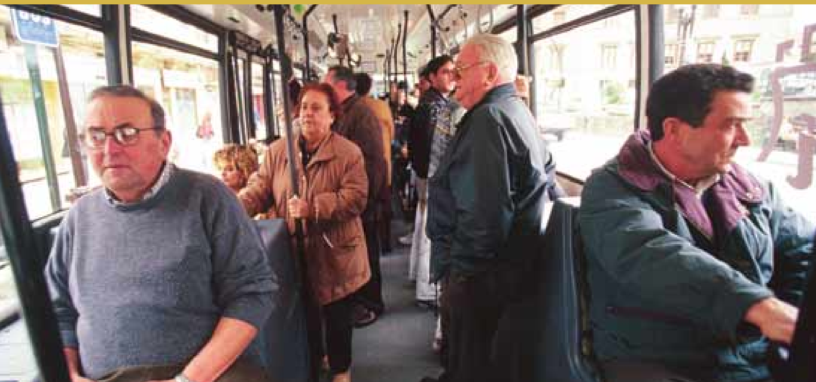
■ Un 55% de los desplazamientos el pasado año se realizaron con el Bono-Bus.

Urdanibia. En cuanto a la frecuencia, de lunes a viernes, se ha pasado de 30 a 20 minutos.