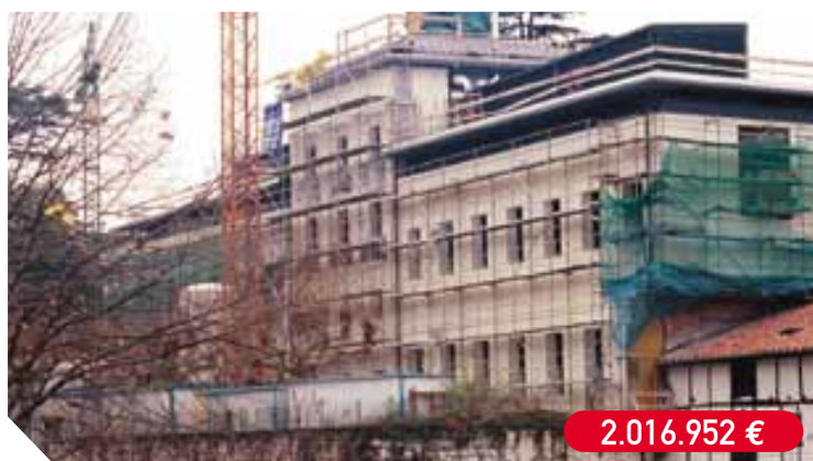
Construcción del Museo de la Romanización del Golfo de Vizcaya, Oíasso