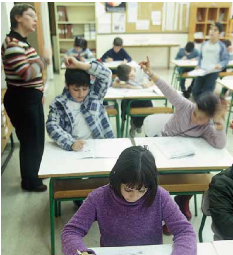
■ El Ayuntamiento también aporta cantidades económicas a iniciativas extraescolares.

El Consistorio comparte, asimismo, la constante necesidad del profesorado de adaptarse a las nuevas necesidades docentes, por lo que aporta 3.000 euros a las XIX Jornadas Pedagógicas del Bidasoa, en las que más de 500 profesionales de la educación se dan cita para conocer aspectos devenidos del actual sistema educativo y se ofrecen experiencias que han resultado exitosas en otras aulas.