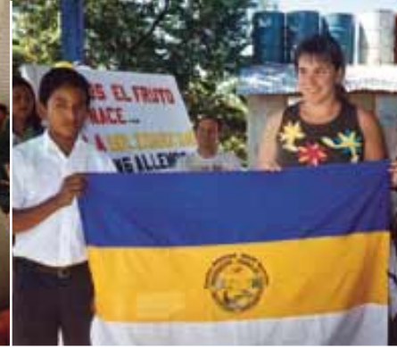
IRUN SOMOTOREKIN 13