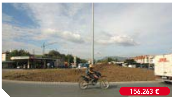
Ajardinamiento de la rotonda de Behobia y diferentes zonas en la avenida de Letxunborro