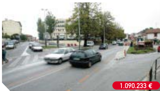
Reurbanización de la avenida de Elizatxo, entre la calle Serapio Múgica y el instituto Bidasoa, y construcción de una rotonda en la intersección con la calle Aduana