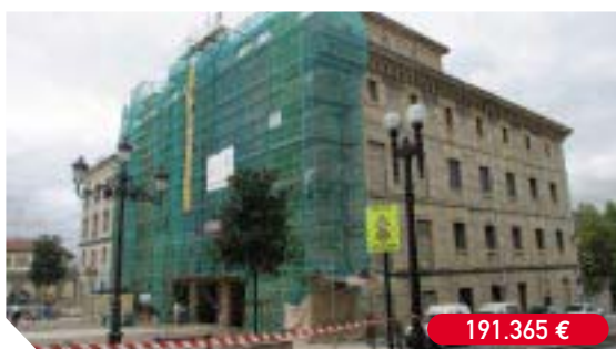
Limpieza y restauración fachada del Ayuntamiento