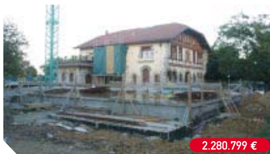
Ampliación del Conservatorio Municipal de Música