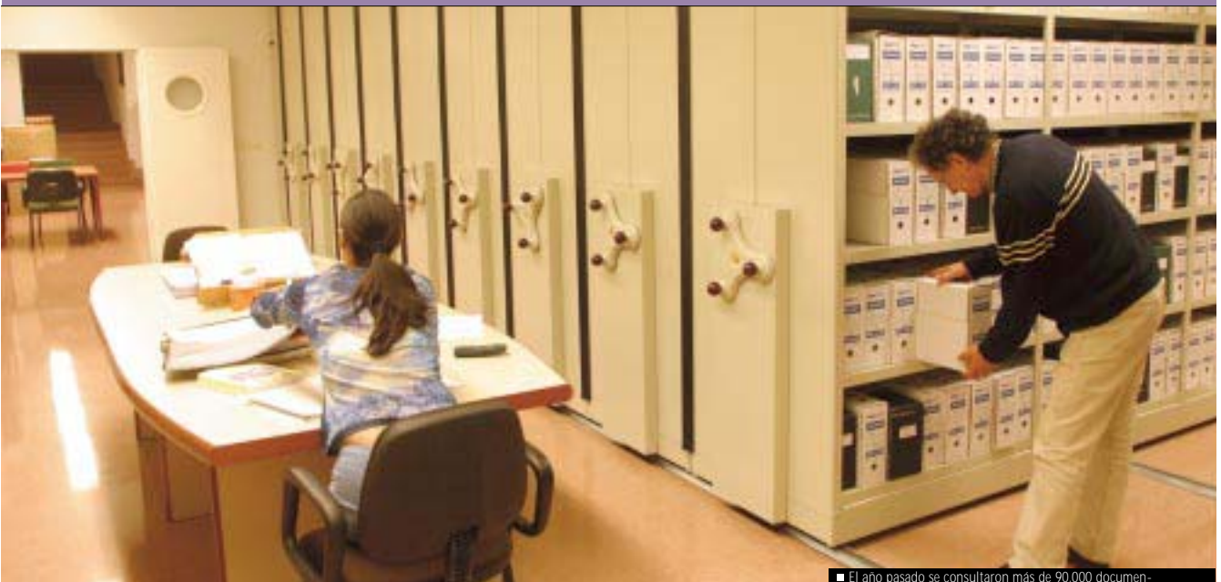
■ El año pasado se consultaron más de 90.000 documen-