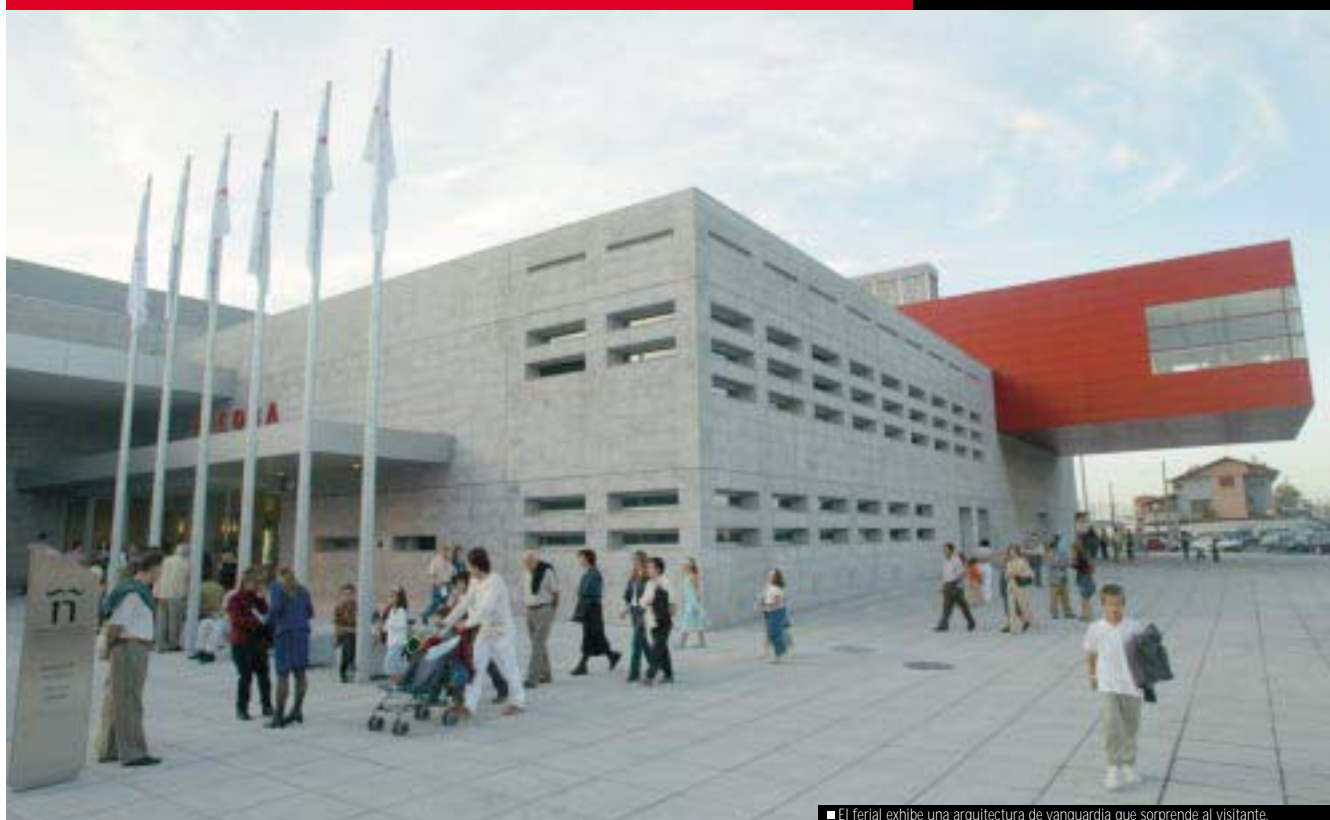
■ El ferrial exhibe una arquitectura de vanguardia que sorprende al visitante.