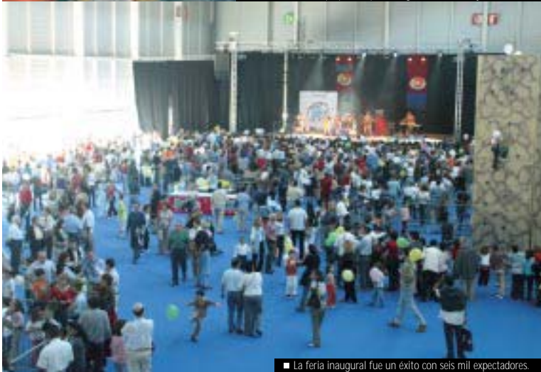
■ La feria inaugural fue un éxito con seis mil expectadores.