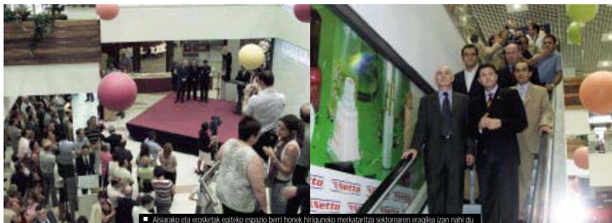
■ Aisiarako eta erosketak egiteko espazio berri honek hiriguneko merkataritza sektorearen eragilea izan nahi du

Este nuevo espacio para el ocio y las compras quiere servir de motor para el sector comercial de la zona centro y es uno de los proyectos que la ciudad ha puesto en marcha para su reconversión comercial, urbana y económica.