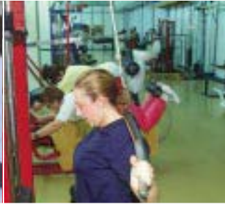
KIROLA OSASUNA DA 11