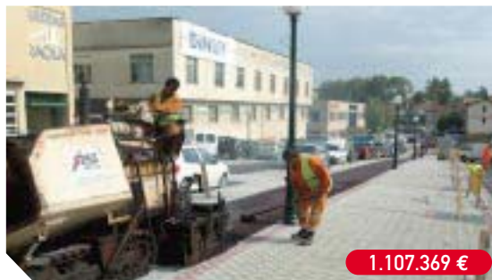
Urbanización de la calle Auzolan, en el alto de Arretxe