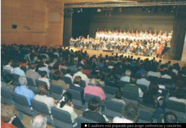
■ El auditorio está preparado para acoger conferencias y conciertos.