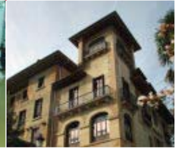
JOYAS DE PAPEL 12