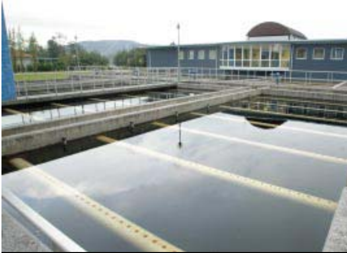
■ Las instalaciones de la potabilizadora de Elordi garantizan la calidad del agua que se suministra a la ciudad.