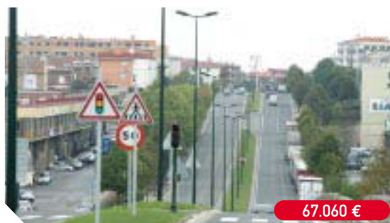
Colocación de farolas en la avenida de Letxunborro