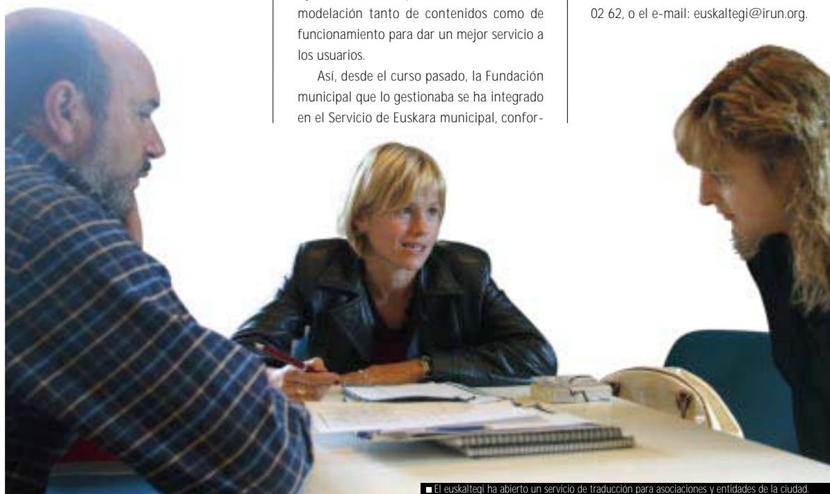
■ El euskaltegi ha abierto un servicio de traducción para asociaciones y entidades de la ciudad.

Esta prestación es especialmente útil para el ciudadano y para asociaciones deportivas, culturales, vecinales o comerciantes, ya que se les traducen gratuitamente sus textos informativos. Para ello pueden acudir con el texto al Euskaltegi, o ponerse en contacto con el mismo a través del teléfono 943-62 02 62, o el e-mail: euskaltegi@irun.org.