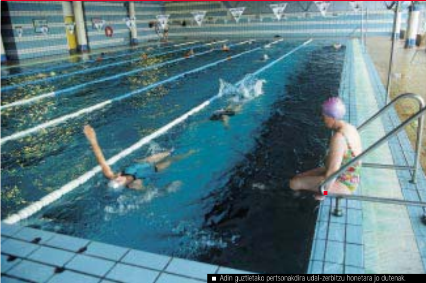
■ Adin guztietako pertsonak dira udal-zerbitzu honetara jo dutenak.