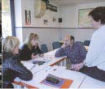
EUSKARA GUZTIONTZAT 10