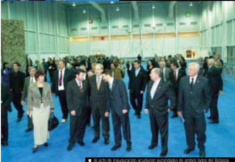
■ Al acto de inauguración acudieron autoridades de ambos lados del Bidasoa.