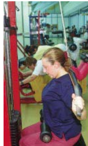
■ Sasoian programaren bidez ohitura osasungarriak sustatu nahi dira.

Sasoian aurrendari da European, eta Gipuzkoako Foru Aldundiarekin eta Osakidetzarekin batera jarri da martxan. Hala ere, Txingudi Merkataritza Zentroaren eta Kutxaren babesarekin.