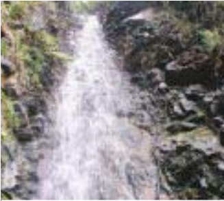
AGUAS LIMPIAS 6