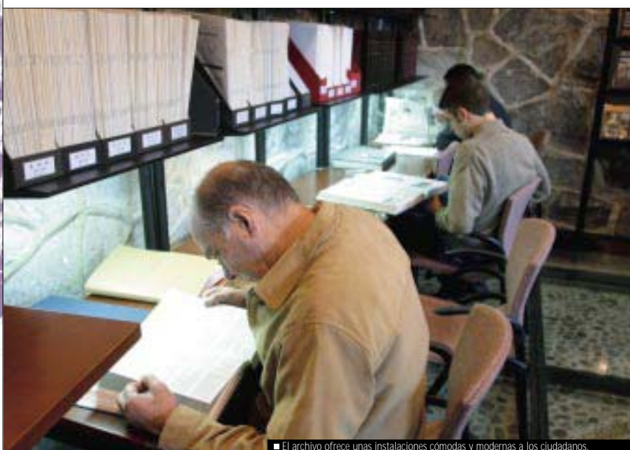
■ El archivo ofrece unas instalaciones cómodas y modernas a los ciudadanos.

“Alberga una de las recopilaciones de documentos más importante de Gipuzkoa entre los siglos XVII a XX”