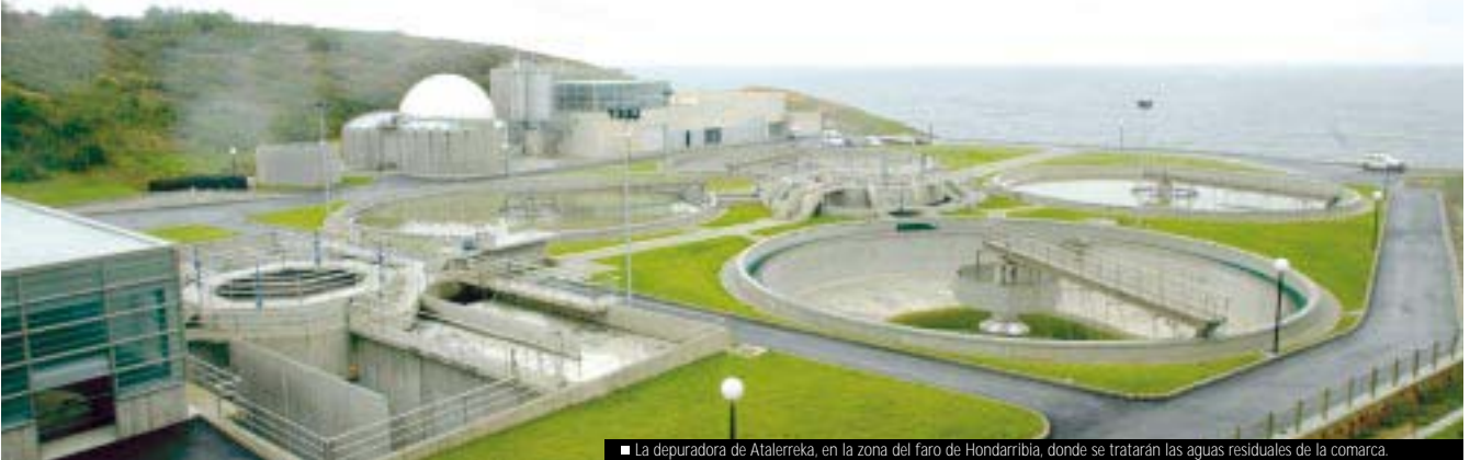
■ La depuradora de Atalerreka, en la zona del faro de Hondarribia, donde se tratarán las aguas residuales de la comarca.