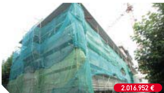
Construcción del Museo Oiasso