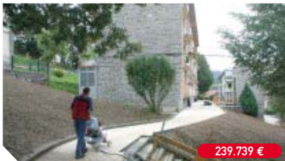
Urbanización de los accesos peatonales de las casas de Palmera