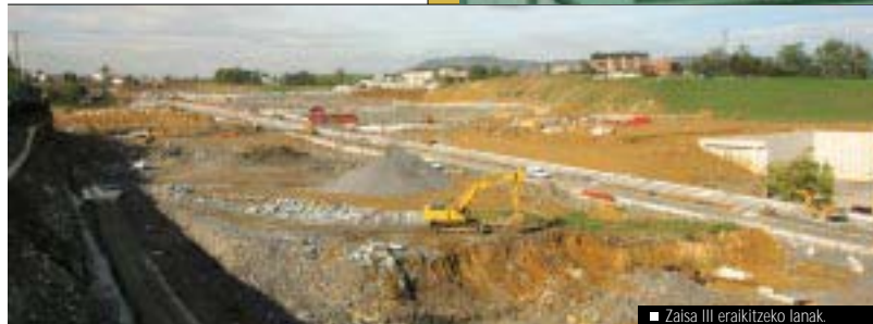
■ Zaisa III eraikitze lanak.

Badirudi iraultzaile frantsesen aurrean Irundarrek izandako kementa oroitzeko eraiki zutela, baina Urdabiniako jaunaren omenaldi gisa eraiki zutela esaten dutenak ere badira; jaun horrek Arantzateko etxeari su eman zion barruan babestu ziren etsaiekin bukatzeko.