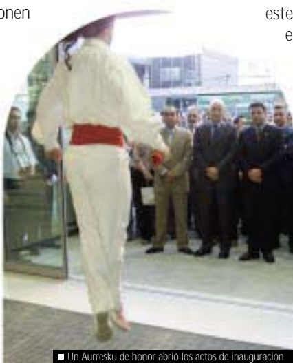
■ Un Aurreraketa de honor abrió los actos de inauguración

Aisiarako eta erosketak egiteko espazio berri honek hiriguneko merkataritza sektorearen eragilea izan nahi du, eta hiriak merkataritza, hirigintza eta ekonomiaren birmoldaketari begira abian jarri dituen proiektuetako bat.