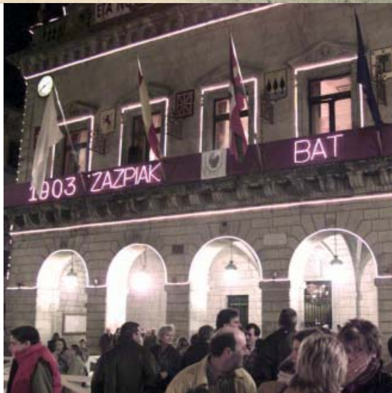
Aurtengo Euskal Jaien hasierako ekitaldia

Orain dela mende bat bezala Euskal Jaiak biribiltzeko, Udalak Gernikako Arbolaren adar bat aldatuko du oraindik zehaztu gabe dagoen leku batean. Irungo historiari buruzko liburu bat argitaratuko da, eta Euskal Jaiari buruzko argitalpen berezi bat ere plazaratuko da.