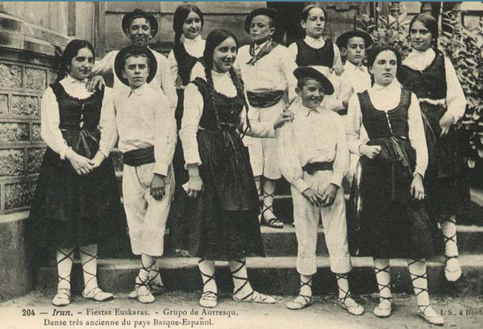
1903an ospatutako Euskal Jaien irudi bat

Donostiako Orfeoiaren emanaldia, Euskadiko Orkestra Sinfonikoarekin batera.