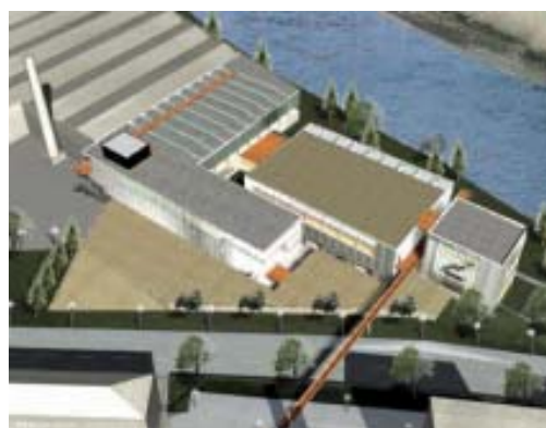
Proyecto de la nueva zona deportiva de Artia

En el presupuesto de este año se alcanza un objetivo planteado en el programa de gobierno municipal como es la dedicación del 1,5% a la cooperación al desarrollo, con ayudas a proyectos relacionados con el Tercer Mundo por valor de 596.740 euros. De esta forma, Irun se convierte en uno de los municipios de Euskadi que más destina a este capítulo.