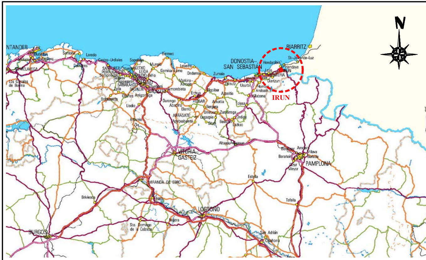
SITUACION Escala: 1/300.000