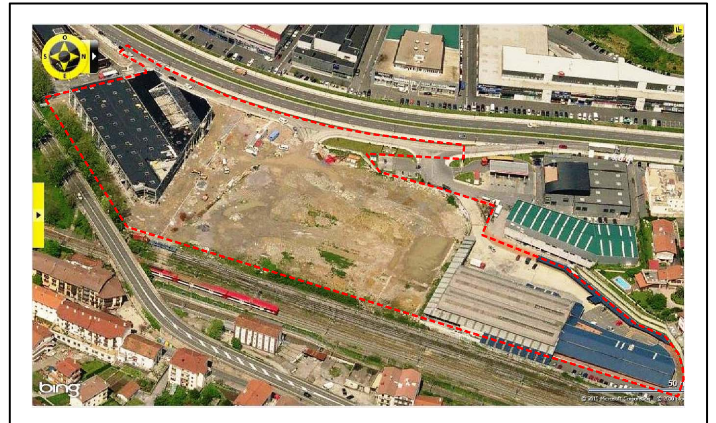
EMPLAZAMIENTO. Vista Aérea Escala: 1:2.000