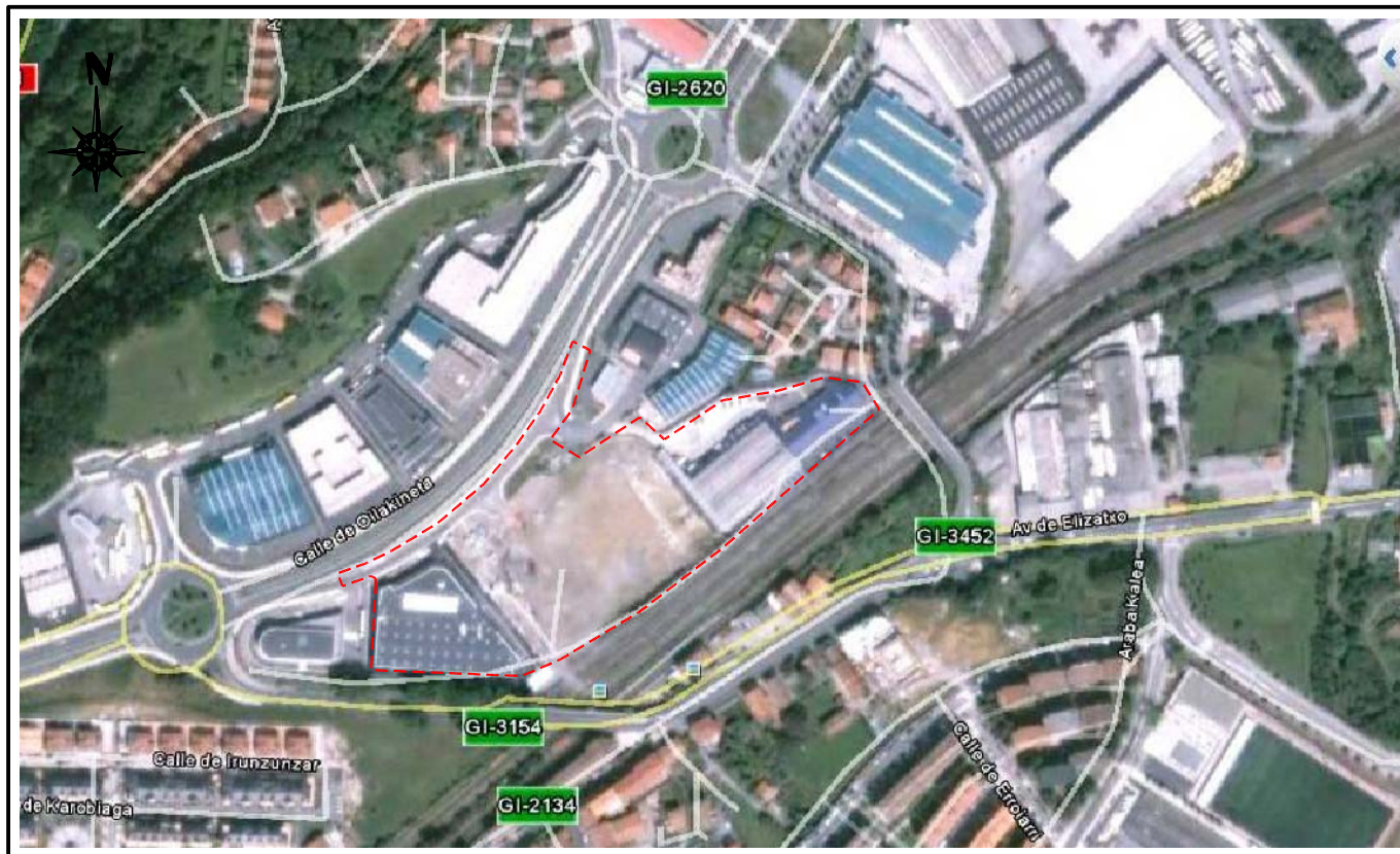
EMPLAZAMIENTO. Vista Satélite Escala: 1:5.000