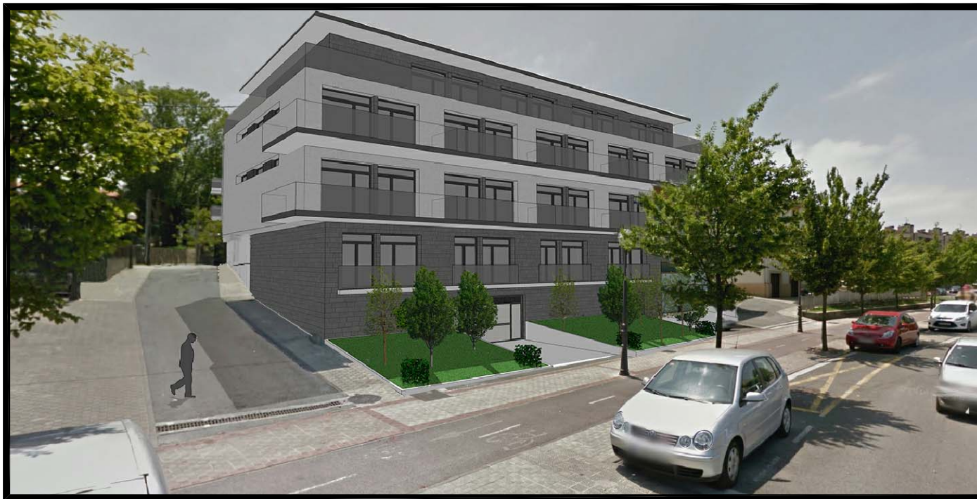
IMAGEN, IDEA DE VOLUMEN Nº 1