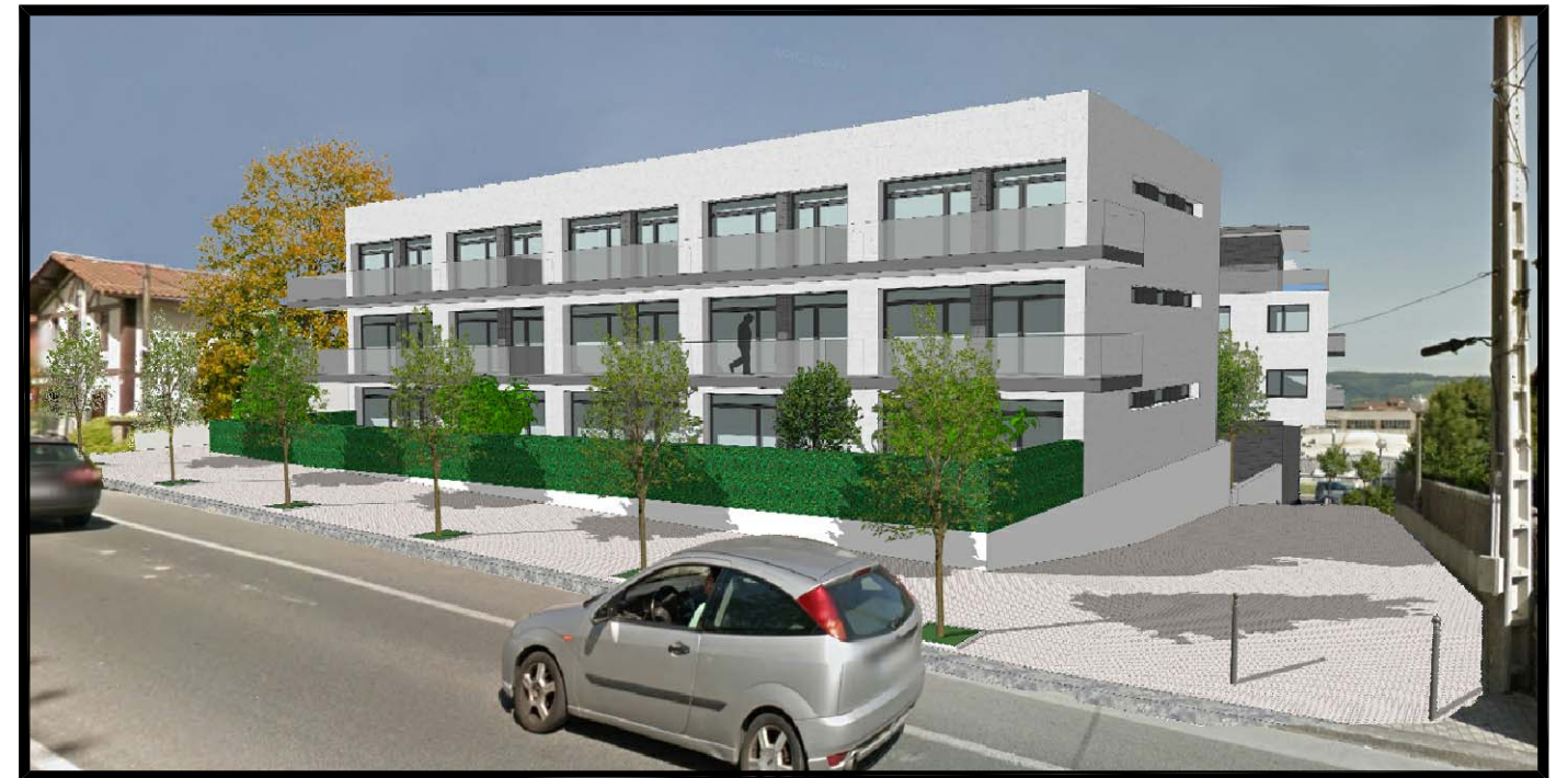
IMAGEN, IDEA DE VOLUMEN Nº 2