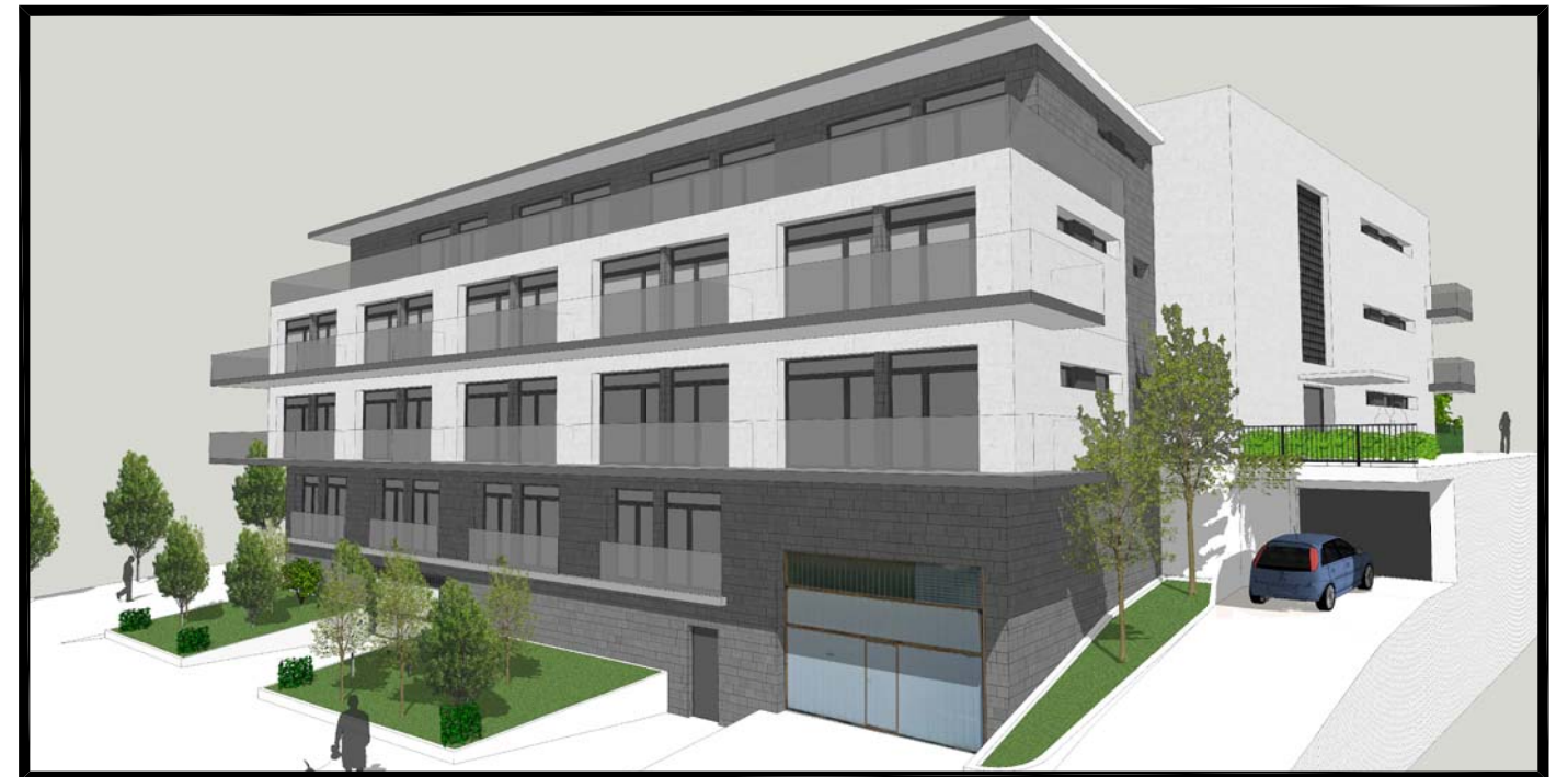
IMAGEN, IDEA DE VOLUMEN Nº 4