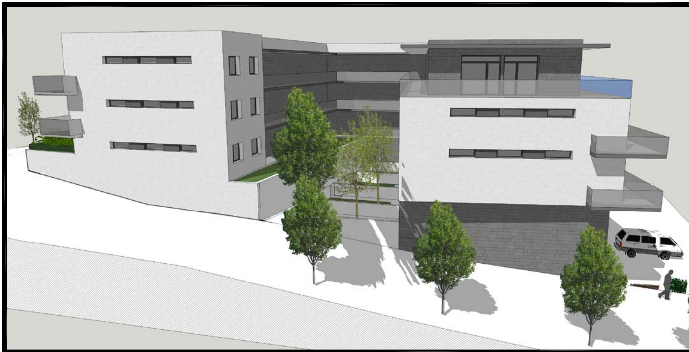
IMAGEN, IDEA DE VOLUMEN Nº 3